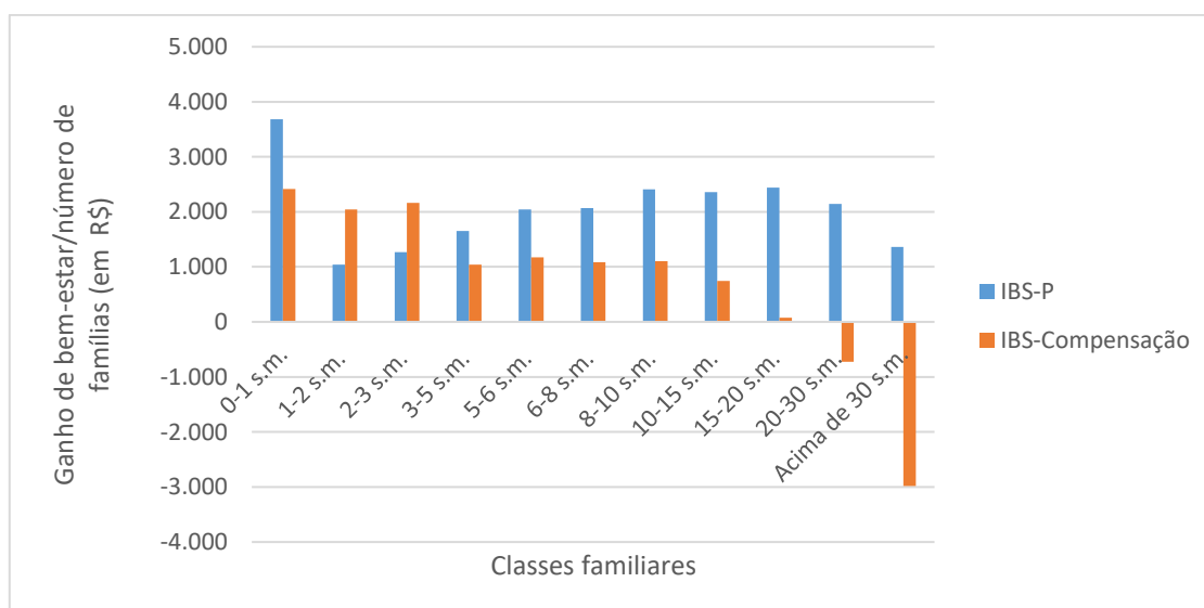
Figura 2: Ganho de bem-estar em relação ao número de famílias em cada classe familiar medido por Variação equivalente, em R$