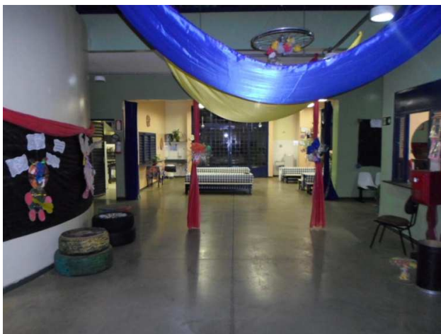
FIGURA 1: Espaço da EMEI Ciranda organizado pelas professoras.