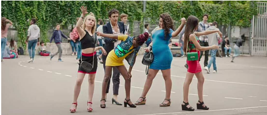
Figura 4: As meninas em performance na escola