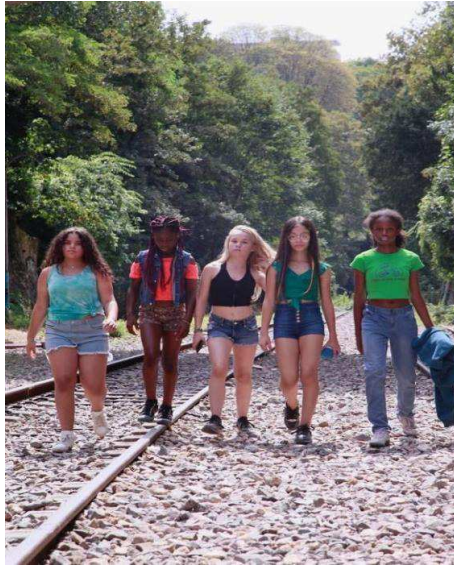
Figura 2: Atrizes-mirins do filme em plano aberto