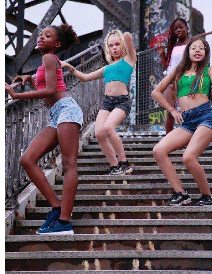
Figura 3: Close-up sensual das atrizes-mirins

Com efeito, por meio das cenas do filme, são narrados, de modo sensível, corpos de personagens femininos, inscritos por histórias que evidenciam a tensão entre culturas distintas; corpos de meninas em movimento, durante os ensaios de suas coreografias de dança, assim como nos diálogos e nas expressões de acolhimento e de companheirismo deflagrados pela interação com os pares; corpos de mulheres adultas, as quais, embora cobertos por longas túnicas muçulmanas e jihads , demonstram a potência dos olhares, dos afetos, das crenças e do estar junto como modo de comunicação.