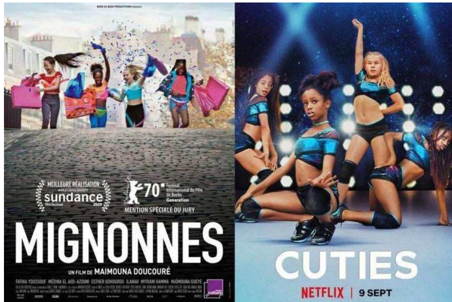
Figura 1: Cartazes de divulgação do filme