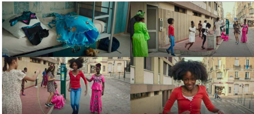
Figura 12: Hibridização de Amy

Bhabha (1998, p. 241), “[...] a cultura como estratégia de sobrevivência é tanto transnacional como tradutória”. Na cena seguinte, o conjunto de lycra utilizado no concurso de dança, disposto em cima da cama, ao lado do vestido que seria usado no casamento do pai de Amy, são elementos visuais que evidenciam que a menina, para tornar-se uma mulher livre, não necessariamente precisaria romper com os costumes, tampouco teria de adotar novos hábitos, mas que necessitaria ressignificar seu lugar social, aliás, seu entrelugar (Bhabha, 1998).