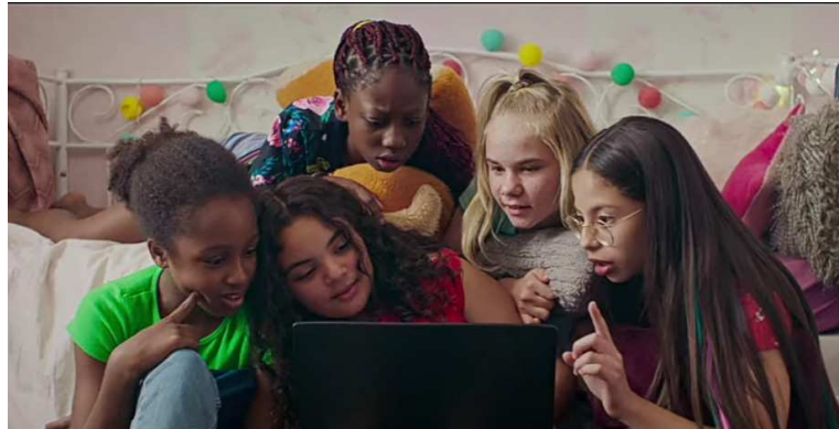
Figura 10: As meninas nas redes sociais