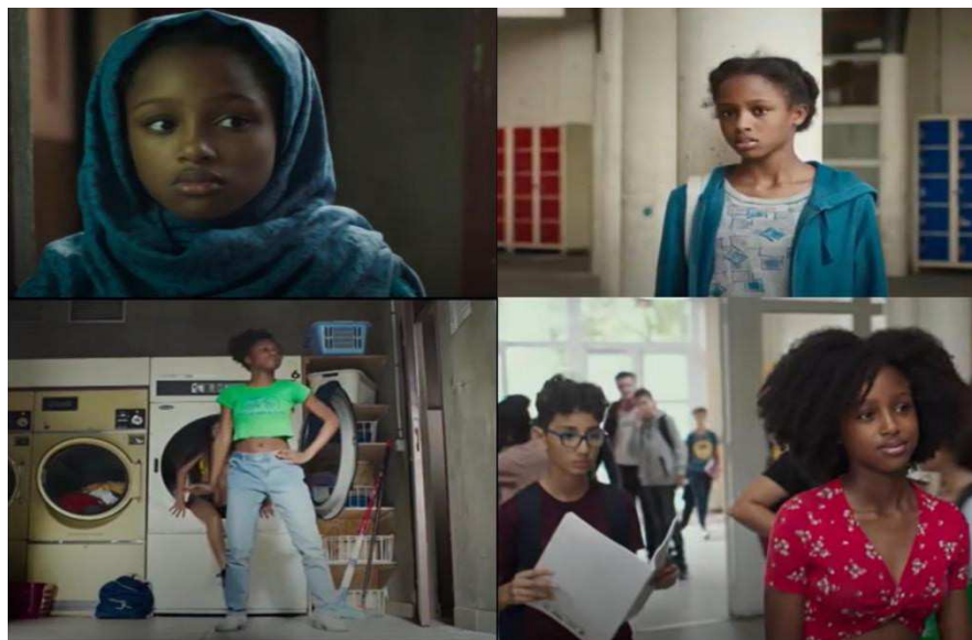
Figura 8: Transformações de Amy ao longo do filme