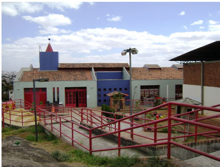
UMEI Caetano Furquim