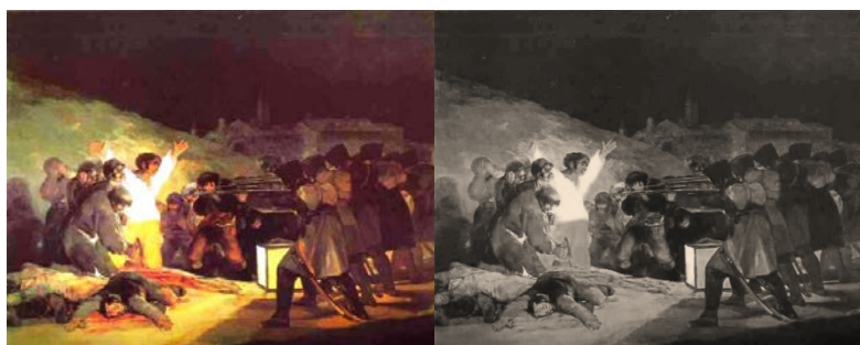
Figura 02 – “O Fuzilamento d 03 de maio”; Francisco Goya

A professora trouxe para sala de aula a imagem da obra “O Fuzilamento” de Francisco Goya. Apresentou para os alunos e solicitou que eles a observassem. Depois pediu para que descrevessem em uma folha, as regiões da obra, onde há maior e menor incidência das cores e das sombras. Embora a professora tenha levado uma imagem colorida, a imagem observada no texto dos alunos eram cópias em preto e branco: