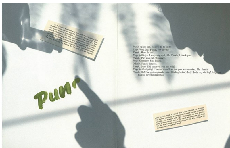
Figura 6. Janet Zweig, Heinz and Judy: a play , 1984.