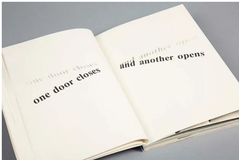
Figura 5. Helen Douglas e Telfer Stokes, Real Fiction (An inquiry into the Bookesque) , Weproductions / Visual Studies Workshop, 1987.

objeto e como processo, além de integrar a palavra à fotografia, dando a ela (a palavra) o status de objeto” (Silveira, 2001: 188).