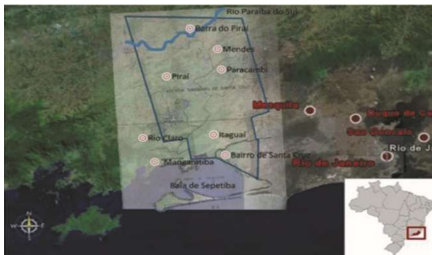
FIGURA 2: Plotagem de planta da Fazenda de Santa Cruz sobre o mapa digital disponível no Google Earth