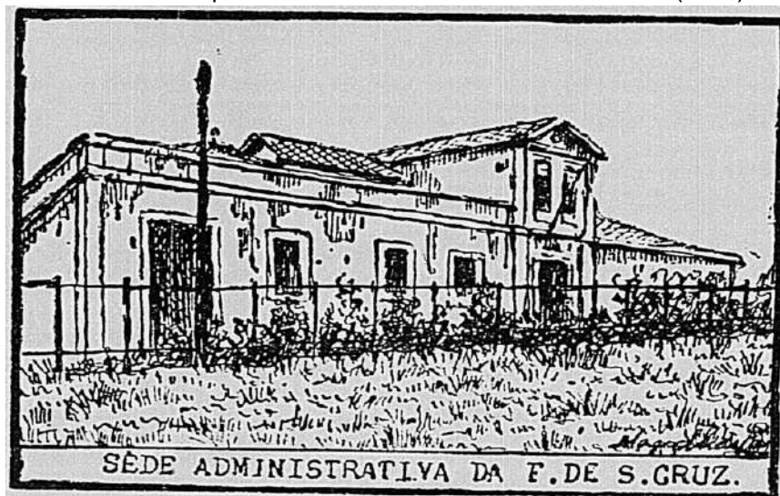
FIGURA 4: Superintendência da Fazenda de Santa Cruz (1939)

Fonte: Litografia da sede administrativa da fazenda de Santa Cruz, por Magalhães Côrrea. In: Correio da Manhã . À margem do sertão Carioca - estradas de rodagem. Suplemento dominical, 09 de abril de 1939. p. 06.