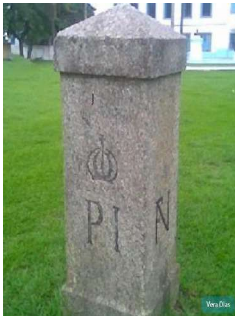
Imagem 2 – Marco de cantaria da Fazenda Nacional de Santa Cruz (1939)