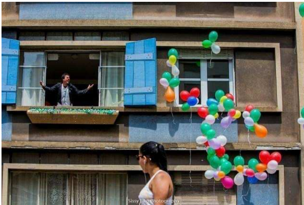
Figura 3 - Die Methode , Cia Deutsches Theater de Göttingen (Alemanha).