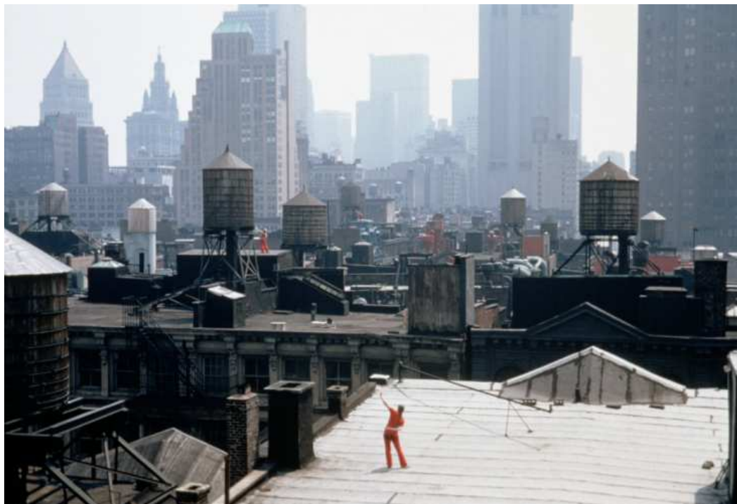
Figura 1 - Performance de "Roof Piece" nos anos 1970, realizada nos telhados do SoHo

É na formação dessas novas ficções que a rua dos que ficaram em quarentena se reergue, seja na vida online ou mesmo fora da internet . É possível que as imagens comecem a subir pelas paredes ou que as artes da cena habitem topos de prédios, como o trabalho da Trisha Brown Dance Company e seu espetáculo Roof Piece (1971) 14 ; ou aconteça nas janelas, como o espetáculo Esparrama pela Janela (2019) que, antes mesmo da pandemia, já realizava suas sessões nas janelas do Minhocão, em São Paulo 15 ; ou seja feito para um público muito restrito ou explorem os serviços de entrega ou drives-thru , como o espetáculo Die Methode (2020), da Cia Deutsches Theater de Göttingen