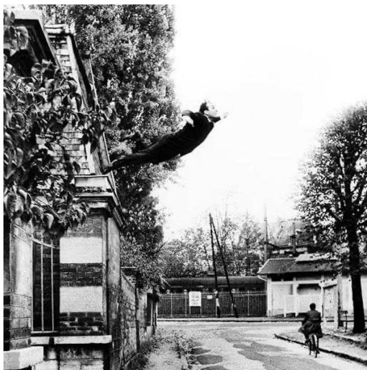
Figura 6 - “Saut dans le vide”. Yves Klein

Especulações em precipício, diríamos. E como precipício, exige que abandonemos os acúmulos, que lancemos fora as arestas do conformismo, as violências da subserviência, as manias embrutecidas do consumo, as justificativas ensaiadas para a negação de qualquer risco, os desejos inconformados de mais e mais informação. Lança tudo por baixo para se jogar de novo à rua, à vertigem, lançando-se ao indeterminado, ao por vir que se anuncia por corpos que, em noites frias de abandono, alimentaram os seus mais profundos anseios. Sonhamos e desejamos um corpo e uma cidade que não sucumbam a unidades imaginárias encerradas em figuras de soberania, em narrativas e possibilidades unas. Por “um corpo social des-idêntico e inquieto, em vez do corpo unitário do imaginário social” (Safatle, 2015, p. 94). Por um agora como força movente no corpo e na cidade, não para um hedonismo fetichizado e higiênico, mas para o compromisso com a vida, com o que ela ativa de terror e ternura, com o que ela evidencia de paixão e não-saber. Para que possamos divinare , como nos falava Manuel de Barros, e, como sabiás, não apenas topografar o acidente que nos espera, mas alçar voo frente ao abismo.