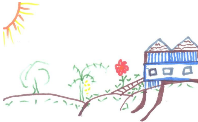
Figura 2 – Representação expressiva de uma casa

No segundo momento, a construção foi direcionada: o desenho deveria ser expressivo, ou seja, deveria ser realizado de forma a conter sentimentos, desejos, intenções e principalmente o conceito que cada um tinha sobre a palavra “casa”. O resultado desse momento apresenta diferenças significantes dos elementos compositivos usados na construção do novo desenho, que ganhou novas formas e cores, como exemplificado na figura abaixo: