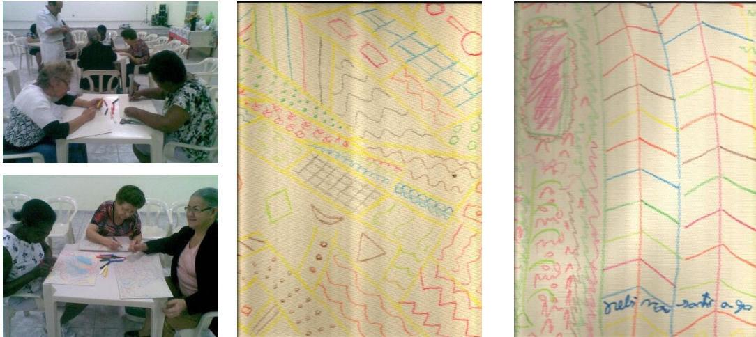
Figura 4 – Prtica do grupo Atividade Viver

Atividade Viver , com oito participantes, onde o trabalho foi desenvolvido de forma individual, utilizando papel paran no formato 28 x 41, conforme pode ser visto na figura abaixo: