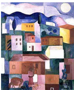
Paisagem Brasileira , 1925 Lasar Segall