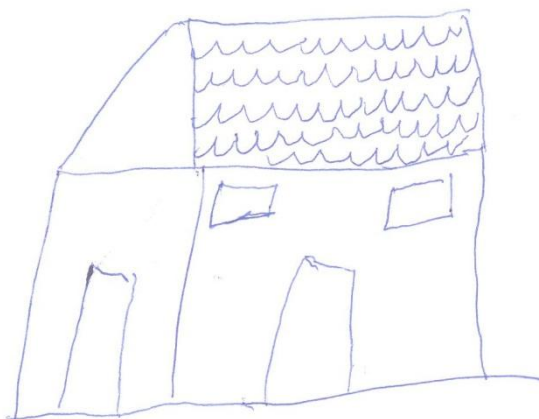
Figura 1 – Representação padronizada de uma casa

No primeiro momento, ainda sem ter contato com qualquer tipo de informação referente à prática, cada participante foi orientado a fazer o desenho de uma casinha utilizando apenas uma cor. A orientação foi que o desenho fosse produzido a partir do referencial que tinham da representação padronizada de uma casa, utilizando apenas traços. Os resultados desse momento são semelhantes, como o exemplo da figura abaixo: