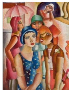
Cinco Moças de Guaratinguetá , 1930 Di Cavalcanti