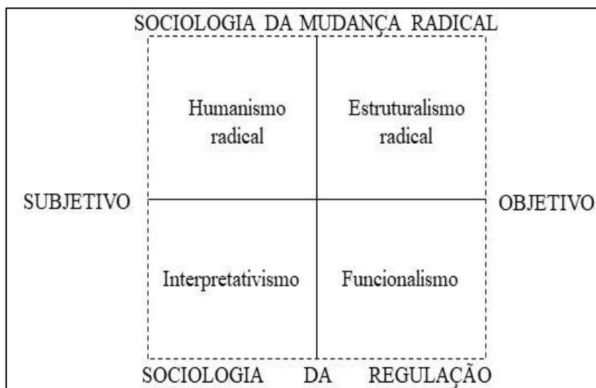
Figura 1 - Quatro paradigmas para a análise da teoria social

São duas as dimensões representadas no diagrama de Burrell e Morgan: a sociologia da regulação e a sociologia da mudança radical. Elas são perpassadas pela contraposição entre uma abordagem pautada na objetividade (que se apresenta como realista, positivista, determinista e nomotética) e outra abordagem pautada na subjetividade (nominalista, antipositivista, voluntarista e idiográfica), que tem como resultado quatro paradigmas: o funcionalismo, o interpretativismo, o estruturalismo radical e o humanismo radical. Sua proposição deu-se com base no debate ontológico, epistemológico, da natureza humana e no debate metodológico (Paes de Paula, 2016), como apresentado na figura 1.