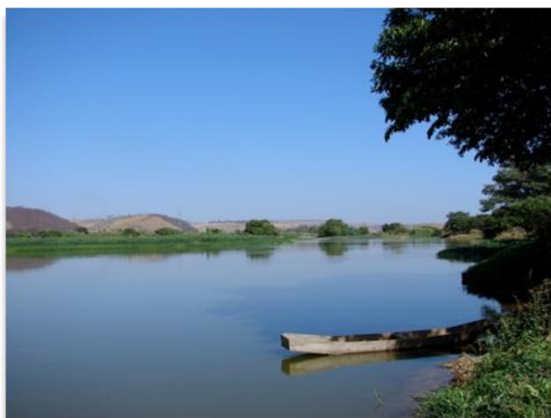
Figura 2: Rio Doce em Galileia Minas Gerais, figura utilizada na 3ª etapa da sequência didática.

Ano: 31 de maio de 2022