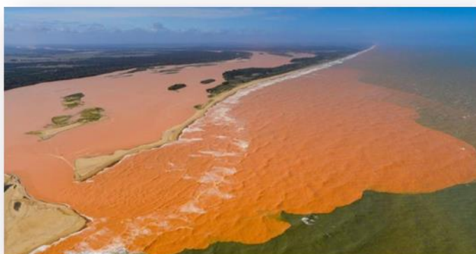
Figura 4: Mar do Espírito Santo: lama que vazou após rompimento da barragem em Mariana (MG). Figura utilizada no 4º dia da sequência didática.

Ano: 31 de maio de 2022