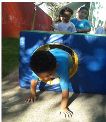
Imagem 3: criança ultrapassando obstáculo.

Também colocamos um obstáculo na parte externa próximo ao parquinho para que pudessem brincar, ultrapassando-o.