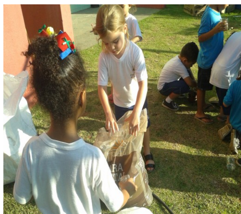
Imagem 4: crianças realizando plantio.

medidas da área. Quando perceberam o trator “limpando” essa área, cortando e derrubando, as crianças ficaram preocupadas e perguntaram “onde os passarinhos iriam morar agora”, uma vez que as árvores foram cortadas. Daí, comecei a motivá-las a pensarem em outras questões ambientais como a preservação da fauna e flora em volta da nossa escola. Ao final propusemos a atividade que consiste em plantar mudas de plantas. Isso seria uma pequena contribuição nessa preservação ambiental. Foram enviados bilhetes para as famílias trazerem as plantas e as garrafas pets onde seriam plantadas. Nisso deveriam escolher dentro das opções – suculentas, kalanchoes, mini cactus. Assim, a professora cortou a garrafa e a escola ofereceu a terra. Fomos para o espaço próximo a horta e cada criança retirava a quantidade de terra e colocava a planta. Depois deveriam molhar e colocar no espaço destinado. Amarramos cada uma das garrafas no pallet que será dependurado no muro da escola.