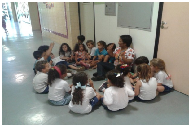
Imagem 1: crianças cantando no hall de entrada.

Em um primeiro momento, foi proposto utilizar o hall de entrada com brincadeira direcionada, porque percebo que as crianças acreditam que só o parquinho é o lugar de brincar. Levamos a caixa de som para momentos de musicalidade. Essa atividade possibilitou tanto apreciar as músicas como movimentar-se ao ritmo dela. As crianças foram gesticulando, repetindo gestos direcionados pela professora e pelas músicas. Foram ouvidas músicas como estátua, pulguinha, sítio do Seu Lobato e outras mais.