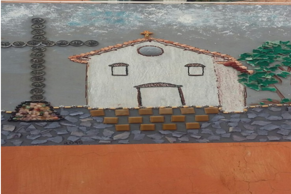
Fonte 11 - Desenho Capela Cruz do Monte