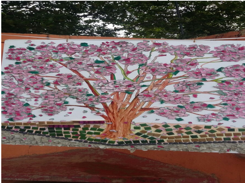
Foto 8 - Desenho Paineira Cor de Rosa da praçinha da Santa Casa

A seguir são apresentados os trabalhos confeccionados pelos alunos a partir das experiências vivenciadas (fotos 8, 9, 10, 11 e 12)