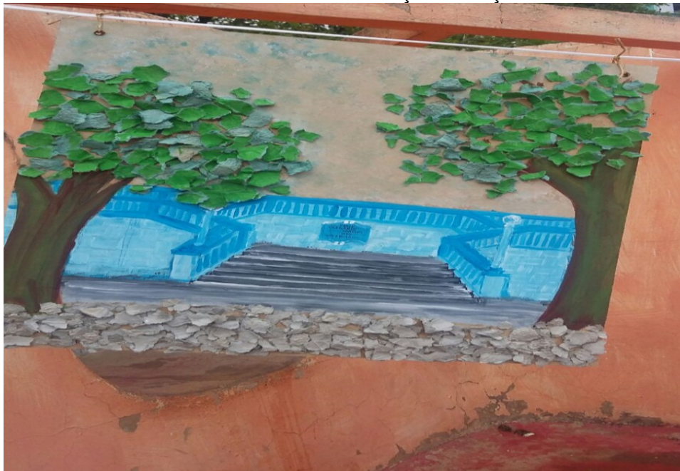
Foto 12 - Desenho Praça da Estação

Capela Cruz do Monte: Usamos tinta guache, ponta de lápis, botões, pastilhas de piso, tinta relevo, pedrinhas. Madeira: 50 cm x 55 cm.