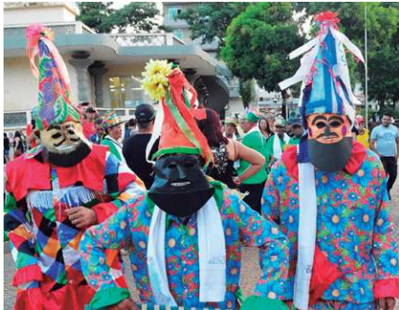
Figura 5 - Foliões na Folia de Reis .

Voltando na questão simbólica, na Folia de Reis (figura 5) observamos alguns ícones parecidos presentes nos manifestantes presentes em O Menino e o Mundo (figura4), as máscaras e os chapéus em formato de cones estão presentes no grupo de festa do filme. Tratando-se especificamente da máscara, já é da natureza da animação o caráter simbólico e lúdico, principalmente quando quer tratar de temas reais em linguagem intencionalmente metafórica, com o objeto máscara não seria diferente. Os personagens são construídos em linguagem simbólica e ainda estão mascarados, conferindo mais mistério e espaço à imaginação do público/audiência.