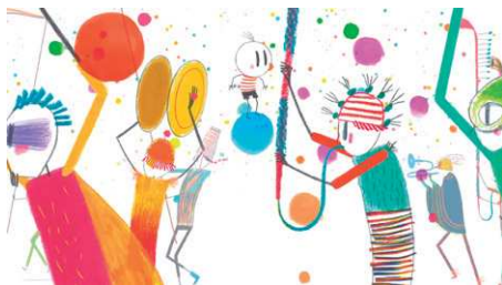
Figura 4 - O festejo popular.

Se tentarmos apontar alguma similaridade com os festejos brasileiros ou latino-americanos, podemos ver bastante semelhanças com uma festa popular específica, católica e interpretada como parte do folclore brasileiro, a Folia de Reis 3 . Nesta manifestação, o grupo de foliões sai numa jornada de horas e interagem com os moradores por onde passam estabelecendo os ritos que fazem parte dessa folia, sem no entanto atrapalhar o processo (Paulino 2010). Vemos esta semelhança com a Folia de Reis , quando o Menino interage com o grupo de forma que não abala o seu rito.