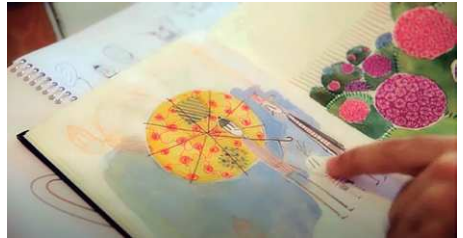
Figura 1 - Diário visual e anotações do Diretor Alê Abreu

da cena, certa interação entre um espaço, uma ação, um ator e um tempo, além da habilidade para a manipulação das qualidades e possibilidades intermediadoras da câmera. (Conde 2014, 160)