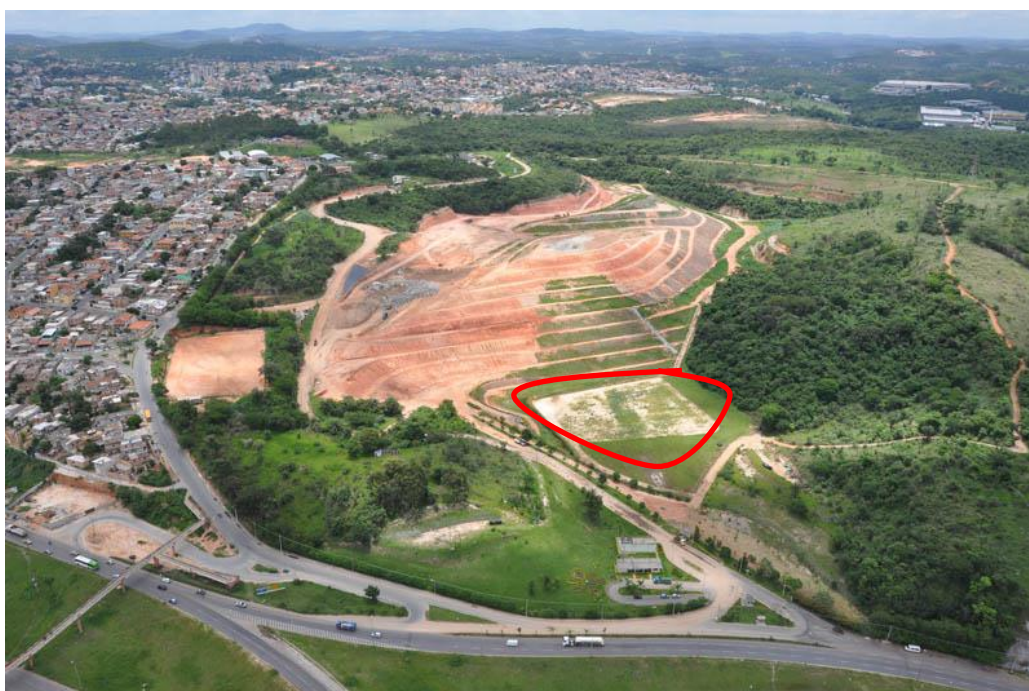
Figura 4 - Área de possível implantação da usina

Existe um terreno com 60ha., sendo que uma parcela de 13ha. é de preservação permanente (APP), que faz parte do Aterro Sanitário do Município de Contagem (figura 00) na Avenida Helena Vasconcelos Costa, nº. 201 no bairro Perobas, sob as coordenadas geográficas de latitude 19^{\circ}54'52,90''S e longitude 44^{\circ}03'27,95''W .