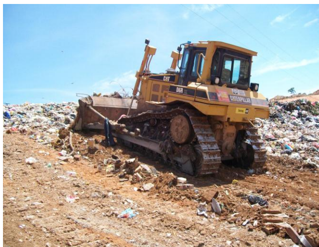
Figura 2- Recobrimento da frente diária de operação com resíduos da remoção mecanizada