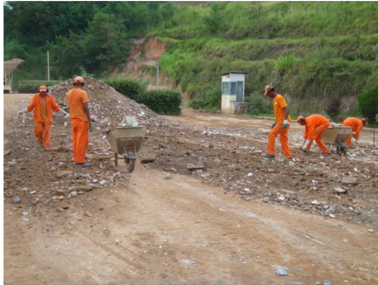
Figura 10 - Triagem manual