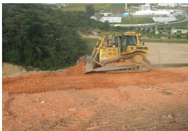
Figura 3 - Compactação dos resíduos e acabamento de plataformas.