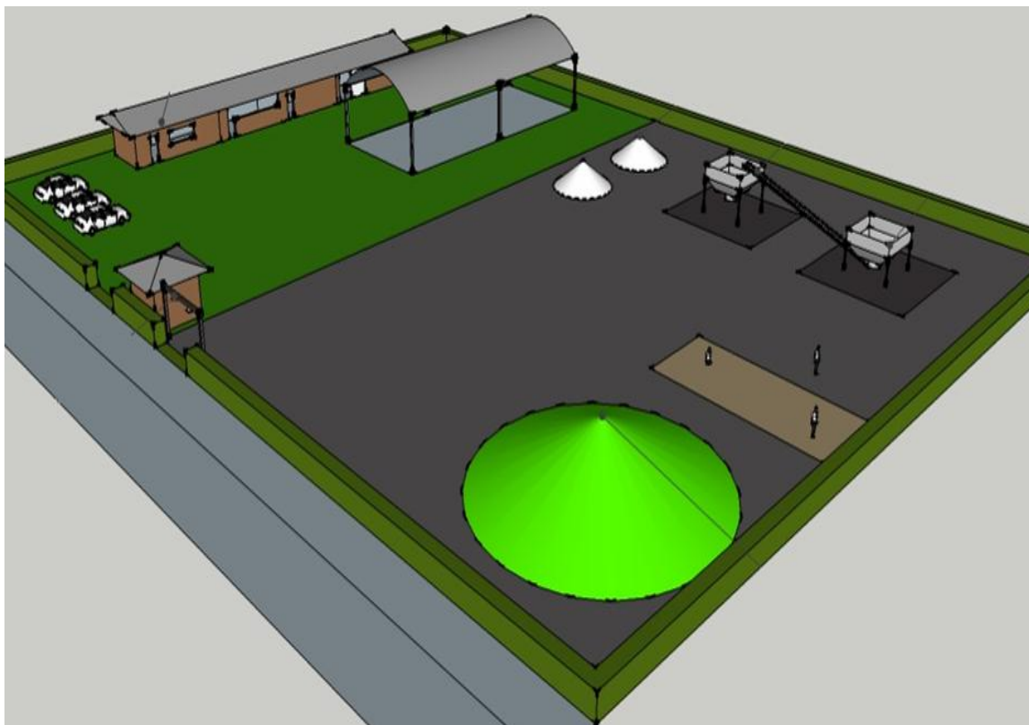
Figura 7 - Layout em 3D da usina