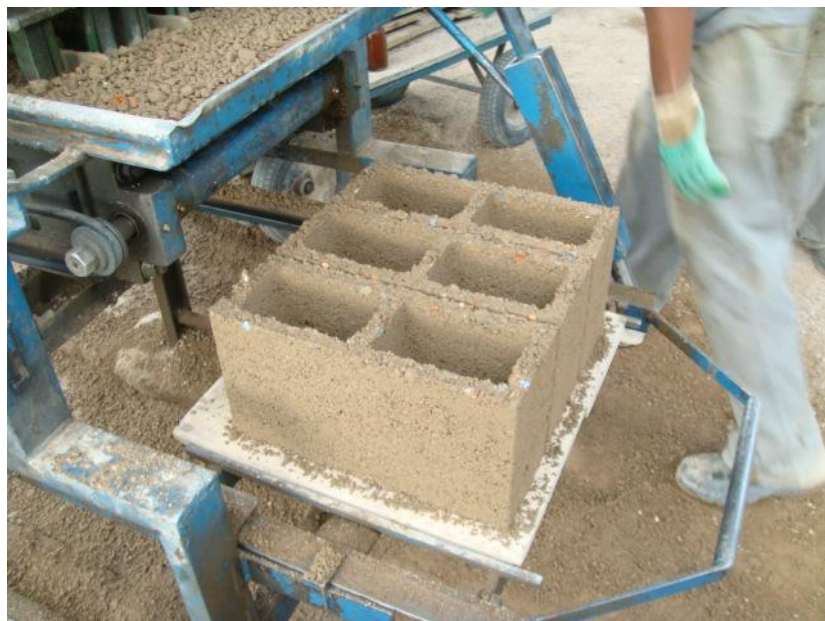
Figura 15 - Bloco de vedação feito com material reciclado