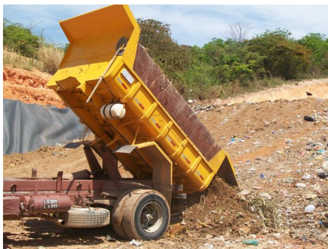
Figura 1 - Recobrimento da frente diária de operação com resíduos da remoção mecanizada

Os resíduos de um município são diversificados e cada um necessita de um destino final, adequado conforme a composição química, o tempo de decomposição e outras características do resíduo. Em Contagem, os resíduos urbanos que são os residenciais, comerciais, industriais classe 2A, especiais e públicos são levados para o Aterro Sanitário pertencente à Prefeitura Municipal de Contagem. Os resíduos de obras públicas como a capina e resíduos dispostos em locais públicos onde não se consegue identificar o gerador ou transportador. São compostos em sua maioria de resíduos da construção civil, porém apresentam certa heterogeneidade, mudando assim a sua faixa de classificação, podendo ser prejudicial ao solo se forem dispostos no Aterro de Resíduos de Inertes. Em função disso, esses resíduos são dispostos no Aterro Sanitário e utilizados como material de cobertura diária dos resíduos com característica domiciliar e também para revestimento da pista de acesso à frente de operação principalmente em períodos chuvosos. Para a coleta desses resíduos são utilizados três (03) caminhões basculantes e uma (01) retro-escavadeira.