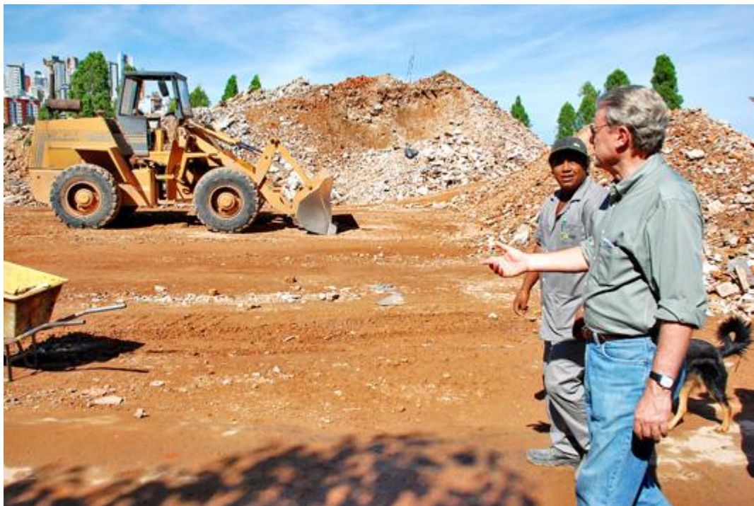
Figura 9 - Carregamento mecânico