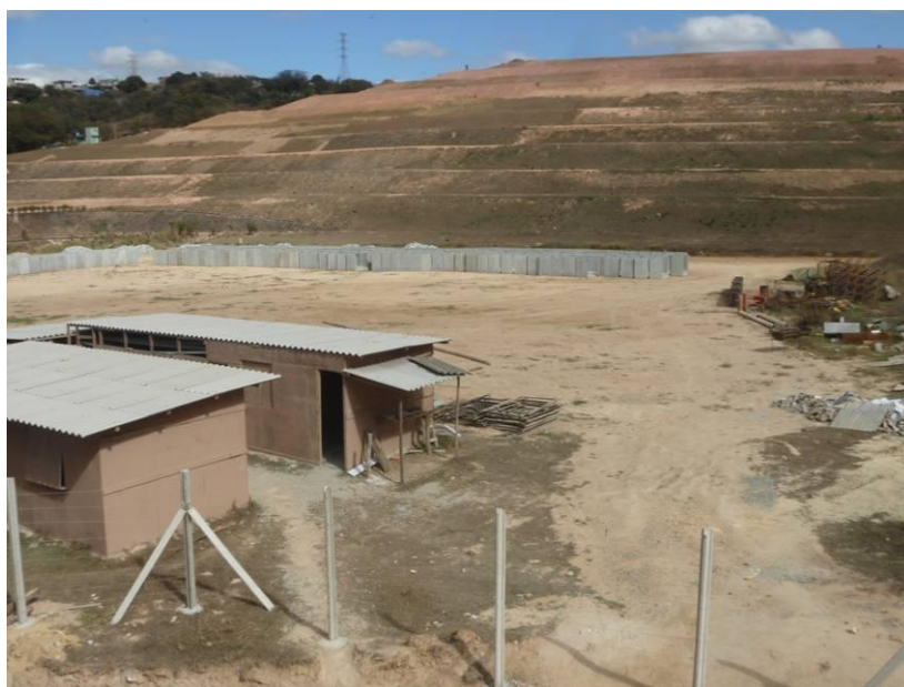
Figura 5 - Vista lateral da área de implantação

A vantagem em utilizar o Aterro Sanitário é de que todos os resíduos seriam destinados ao mesmo local, a maior facilidade para aprovação do espaço para implantação de uma usina de reciclagem com relação às licenças ambientais, e no caso específico de Contagem, proporcionar para a região do Perobas, diversas atividades que colaborem para a urbanização adequada, garantindo qualidade de vida para a comunidade que a habita. A maior parte das residências do bairro Perobas está localizada afastada do terreno, tendo uma escola pública e outros pontos comerciais localizados próximo