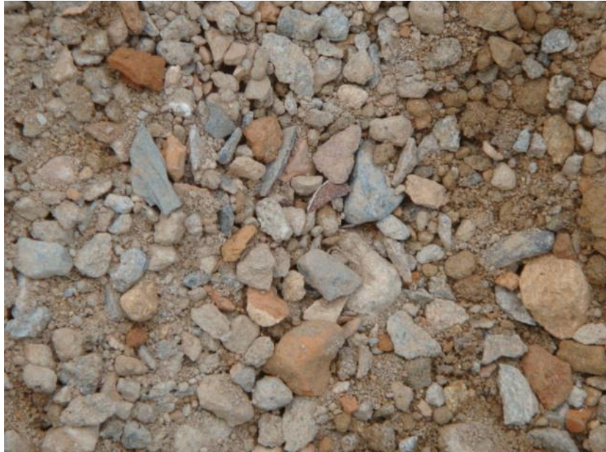
Figura 14 - Material de classe B