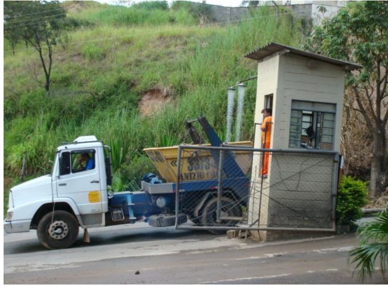
Figura 8 - Recebimento do material da usina Estoril