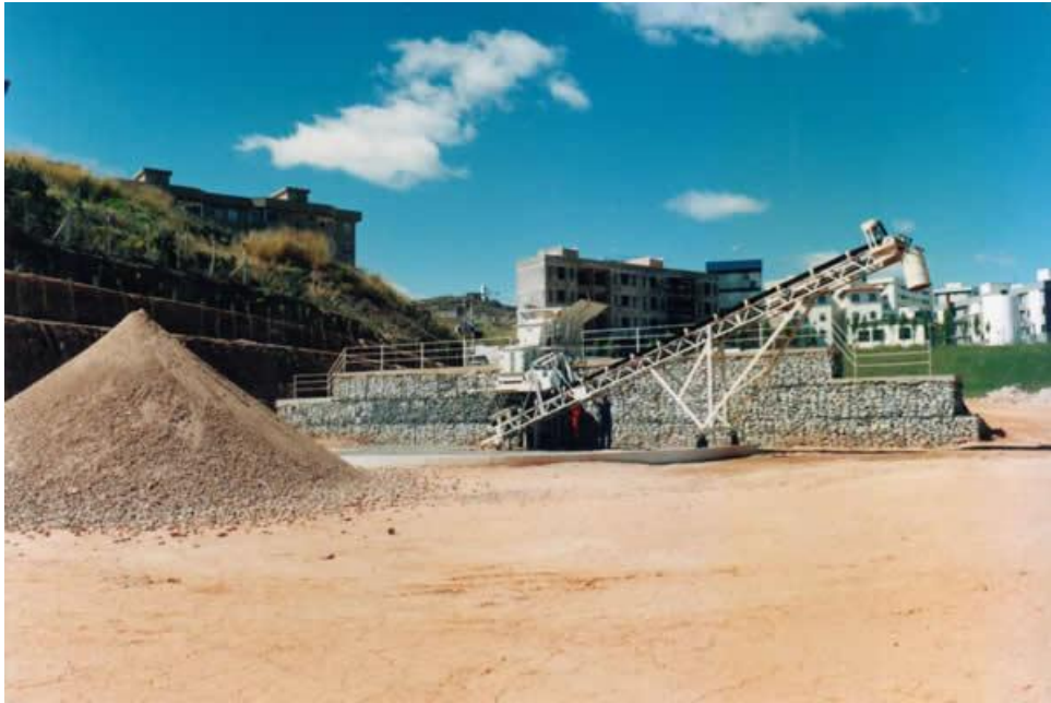
Figura 12 - Equipamento de britagem