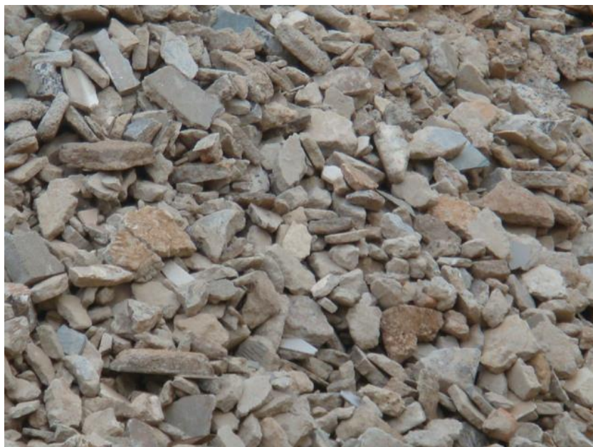
Figura 13 - Material de classe A