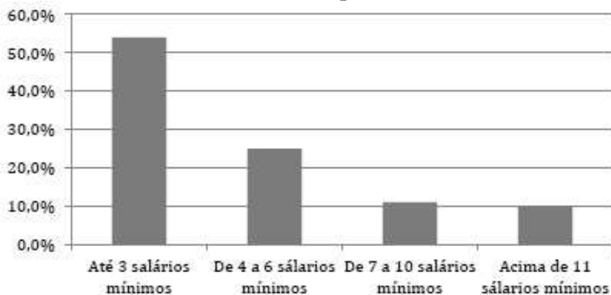
Gráfico 01 - Renda pessoal mensal

graduação. Já outra pesquisa realizada com egressos de cursos de Turismo (públicos e privados) de Curitiba-PR (MEDAGLIA; SILVEIRA, 2010) encontrou um resultado de 62% atuando na área de turismo logo após a conclusão do curso. Sendo que 43% continuou a trabalhar onde já trabalhava (na área) antes de graduar-se, sendo assim o mercado de estágios mostrou-se como possibilidade de abertura do mercado.