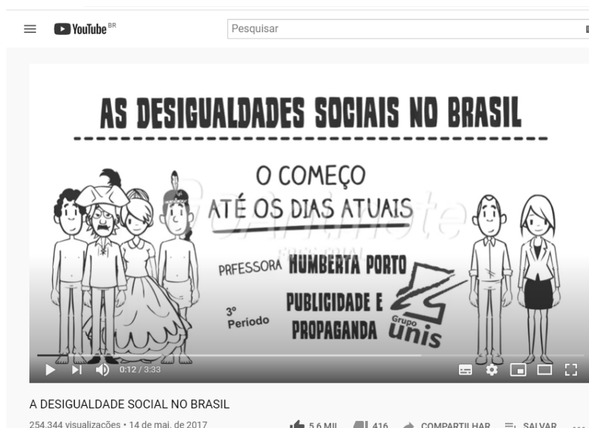
Figura 2 – A desigualdade Social no Brasil.

O professor poderá encaminhar por grupo de WhatsApp, previamente, aos estudantes, vídeo 27 (Figura 2) e link de artigo 28 , disponíveis na Internet, a respeito do tema, até dez dias antes da primeira aula para dinamizar os estudos e a própria aula, considerando um ensino remoto.