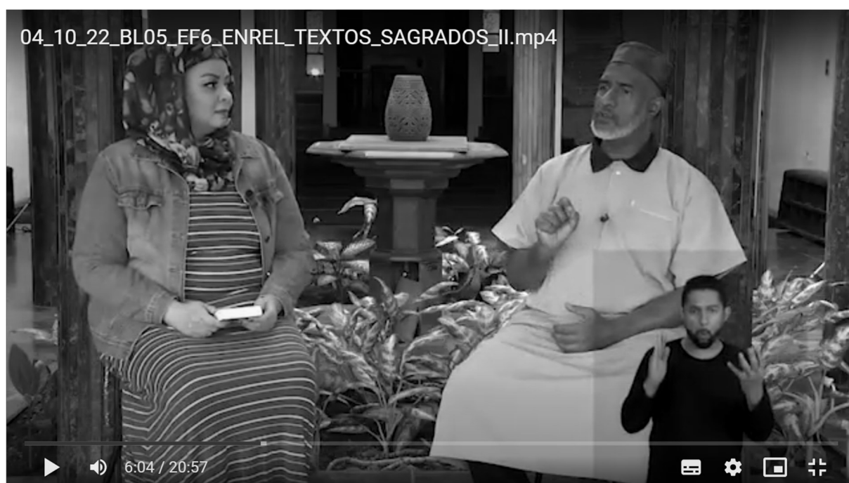
Figura 6 – Aula de Ensino Religioso, Se Liga na Educação

No caso do Ensino Religioso, um desafio enfrentado por longos tempos foi a falta de direcionamento curricular em nível nacional. Esse problema foi resolvido com a promulgação da BNCC. Sua adaptação regional, o CRMG, defende adequadamente a tradição mineira para o conteúdo, o modelo antropológico. Nessa proposta, enfoca-se a busca de sentido do ser humano para sua existência, podendo ou não ser realizada através da religião. Devido à falta de discussão sobre o Ensino Religioso nas licenciaturas, especialmente em Pedagogia, muitos profissionais não têm conhecimento sobre essa abordagem. A exibição das aulas no Se Liga na Educação possibilitou, de forma prática, a divulgação do propósito pedagógico deste conteúdo, demonstrando que não se trata de mera aula de religião ou catequese.