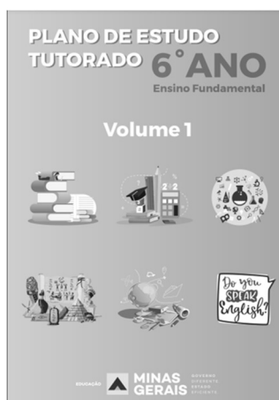
Figura 1 – Plano de Estudo Tutorado

De acordo com suas possibilidades e limitações, cada rede de ensino se organizou em prol das estratégias elencadas. No caso da rede estadual de Minas Gerais, propôs-se uma estratégia denominada Regime Especial de Atividades Não Presenciais – REANP (MINAS GERAIS, 2020b). Esta proposta baseava-se na criação e distribuição de material impresso, os Planos de Estudo Tutorados, e na divulgação de videoaulas através do programa Se Liga na Educação.