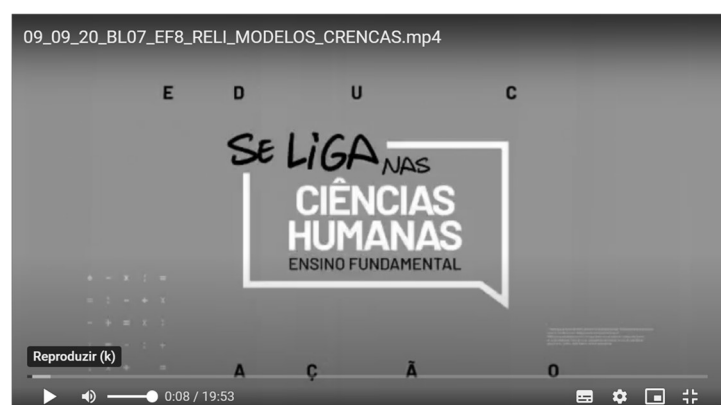
Figura 2 – Identidade visual do Se Liga na Educação