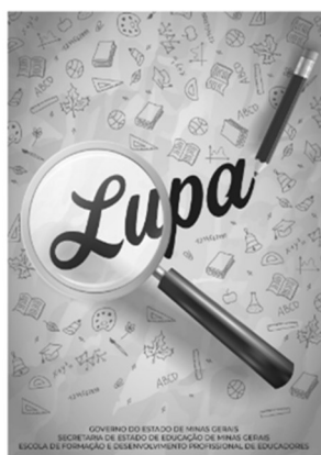
Figura 5 – Jornal Lupa e Caderno Pedagógico