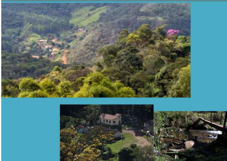
Figura 3. Imagens André do Mato Dentro. Autor: Carmo, 2015

Com o propósito de compreender a construção das ruralidades ali, entremeadas por uma diversidade e sua conservação ambiental que se destacou entre as demais, fomos levados a pesquisar como se dava a re-produção desse rural metropolitano, como ele conseguia manter sua singularidade, a apenas 65 km