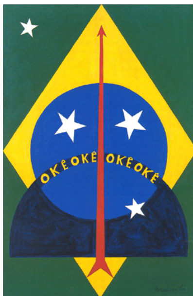
Figura 2 - Pintura “Okê Oxóssi” de Abdias do Nascimento, 1970 – Acervo MASP

A capa do livro de Abdias, traz uma pintura de 1970 também do autor, intitulada “Okê Oxóssi” (figura 2), onde Abdias propõe uma outra bandeira do Brasil, nela se encontra um arco e flecha e a palavra “Okê”, uma parte da expressão Okê Arô!, saudação ao orixá Oxóssi, que vai se repetindo e reinscrevendo o lema positivista da bandeira atual. Perguntado sobre Oxóssi, digo da força civilizatória deste orixá, como aquele que provê ao seu povo a caça, a fartura, não só material, mas a fartura e a prosperidade necessária para a emancipação, para o aquilombamento.