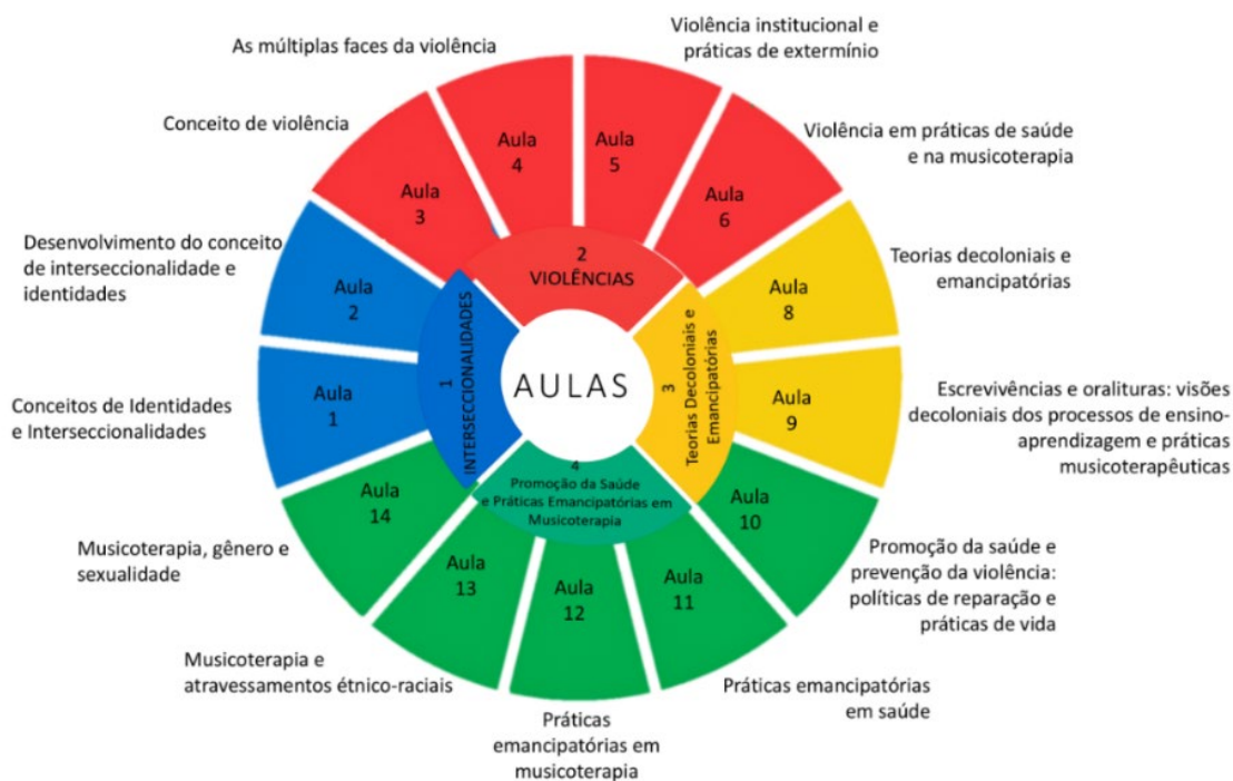
Figura 1 - Esquema representativo das aulas de acordo com cada caminho