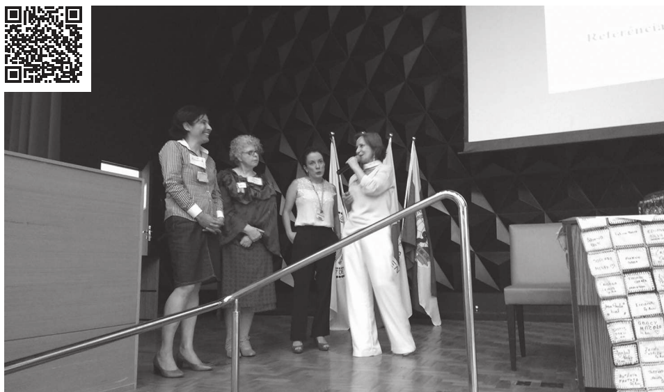
Figura 21.3. - 1º Fórum de Promoção de Saúde e Prevenção da Violência e 1º Fórum Para Elas. Por Elas, Por Eles, Por Nós - momento de lançamento do ambulatório/rede. QR Code: Acesso à imagem colorida.

O ambulatório/rede Para Elas funciona no Serviço de Ginecologia do 4º andar do Instituto Jenny Andrade Faria/HC, todas as sextas-feiras, de oito às 12 horas e conta com a atuação de profissionais de várias áreas do conhecimento. A mulher, ao entrar no ambulatório, recebe cuidados individuais e coletivos integrados, segundo sua necessidade e preferência, de modo que nessas interações sejam construídos vínculos ente elas e entre a equipe e elas; que elas tenham espaço e tempo para refletir, analisar criticamente e vislumbrar soluções para o seu problema e para a sua vida; que elas encontrem motivos e estímulos para continuar e aderir a tais práticas, inclusive no espaço onde vivem; e, enfim, que substituam o cuidado fragmentado por outro integral, participativo e de qualidade, por elas próprias construído.