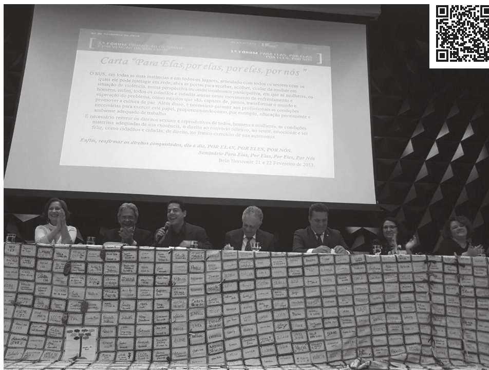
Figura 21.2. - 1º Fórum de Promoção de Saúde e Prevenção da Violência e 1º Fórum Para Elas. Por Elas, Por Eles, Por Nós – mesa de abertura. QR Code: Acesso à imagem colorida.

Violência e 1º Fórum Para Elas. Por Elas, Por Eles, Por Nós, realizados na Faculdade de Medicina, com a presença do Reitor da UFMG; diretores da Faculdade de Medicina e do Hospital das Clínicas; Secretários Municipais de Saúde e de Assistência Social; Secretário de Estado de Direitos Humanos; coordenadora, professores, mestrandos e profissionais do Mestrado Profissional; coordenadora e integrantes do Projeto Para Elas e convidados em geral (Figuras 21.2 e 21.3).