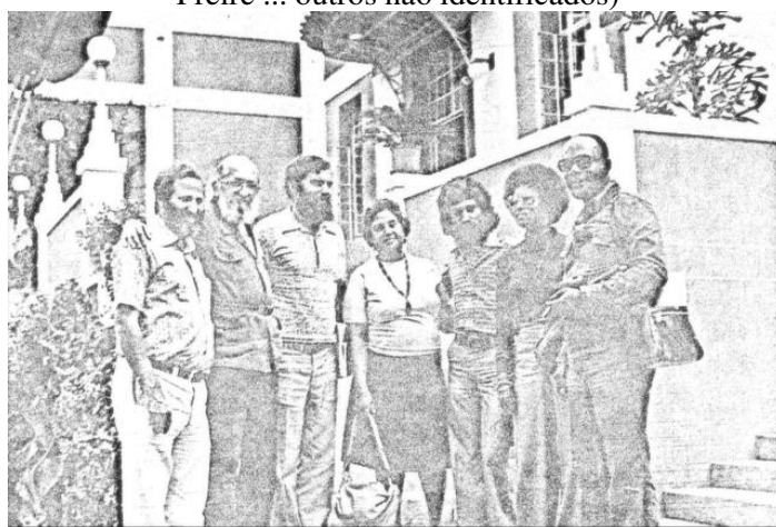
Figura 1 – Foto de Paulo Freire em Angola, agosto de 1976 (da esquerda para direita, Pepetela, Paulo Freire ... outros não identificados)