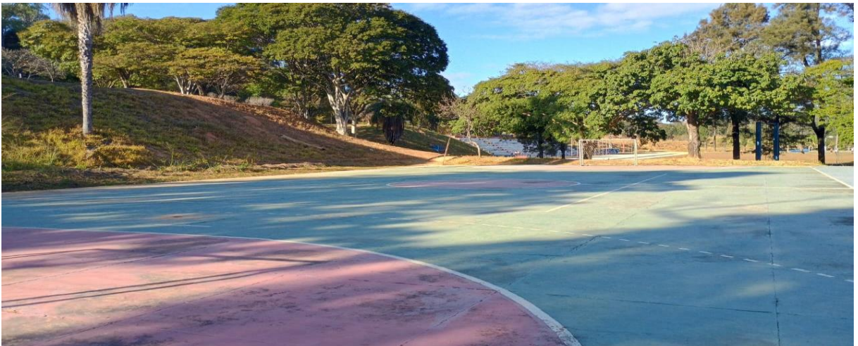
Figura 6: Quadra poliesportiva externa 1