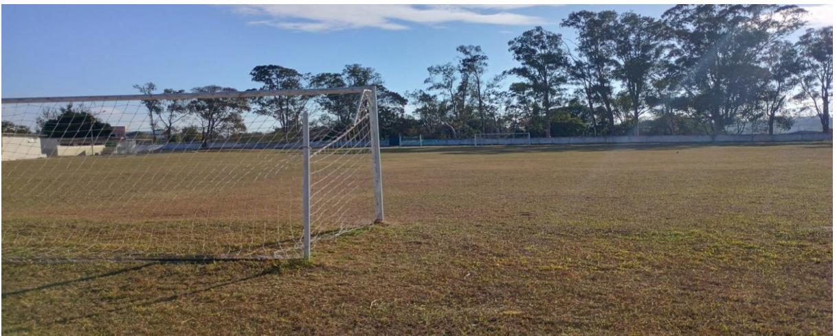
Figura 10: Campo de futebol