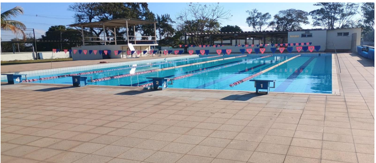
Figura 13: Piscina