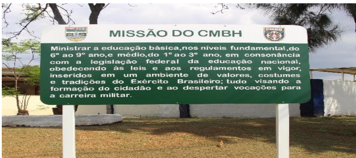
Figura 15. Placa indicando a missão do Colégio Militar de Belo Horizonte

O Colégio Militar de Belo Horizonte (CMBH) pertence ao Sistema de Colégio Militar do Brasil (SCMB) e, assim como todos os demais colégios militares, está subordinado à Diretoria de Educação Preparatória e Assistencial (DEPA). São contemplados no CMBH os anos finais do ensino fundamental (6º ao 9º ano) e o ensino médio (1º ao 3º ano), e a matrícula no CMBH é efetivada sob duas condições: para filhos de militares que atendam aos critérios estabelecidos ou mediante aprovação em um concurso que é realizado anualmente, para alunos que queiram cursar a partir do 6º ano do ensino fundamental ou a partir do 1º ano do ensino médio. Para a caracterização do Colégio Militar de Belo Horizonte, recorreremos aos sites da instituição, bem como ao Projeto Pedagógico dos colégios militares de todo o Brasil.