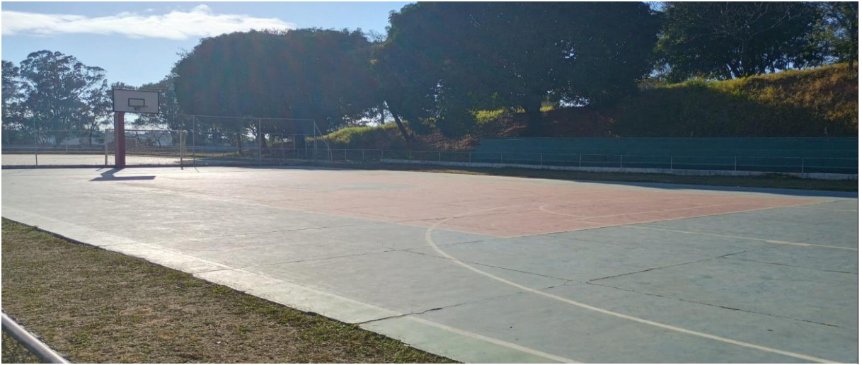
Figura 5: Quadra externa de basquete