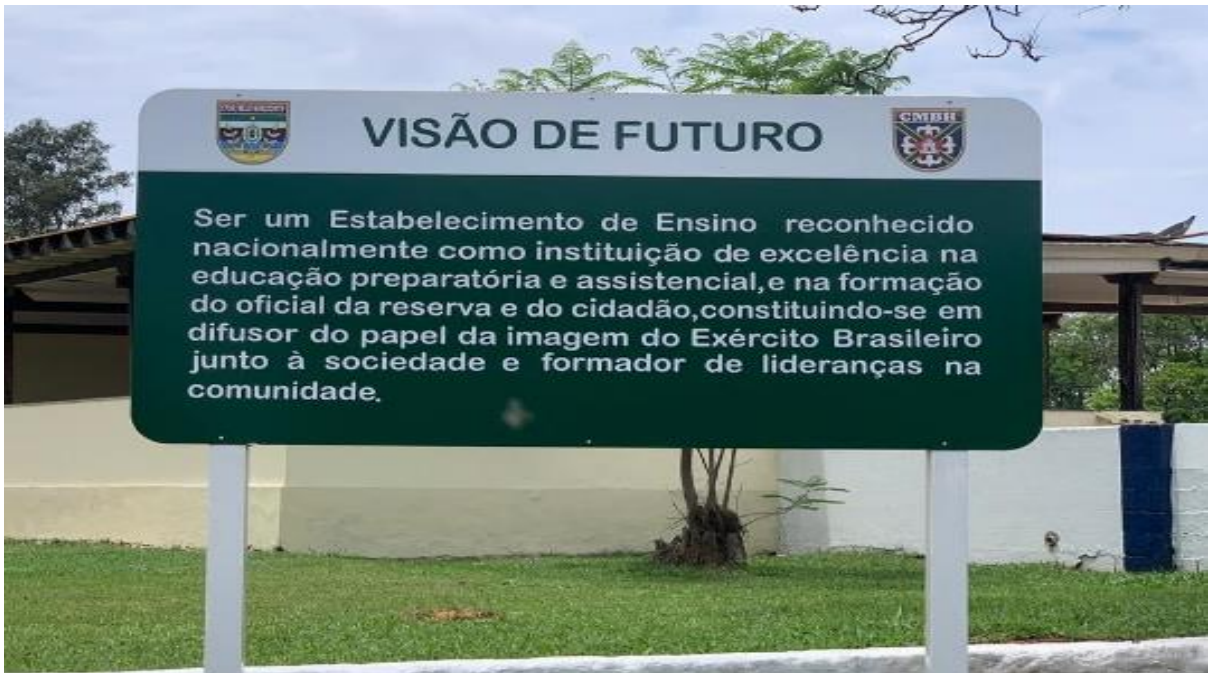
Figura 16. Placa indicando a visão de futuro do Colégio Militar de Belo Horizonte