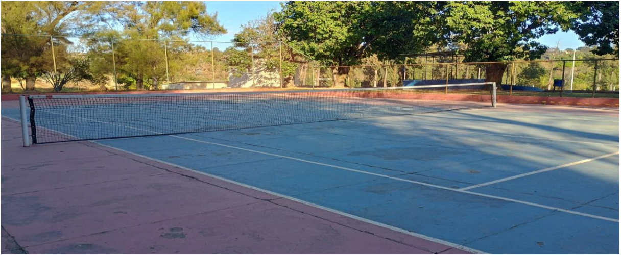
Figura 8: Quadra de tênis