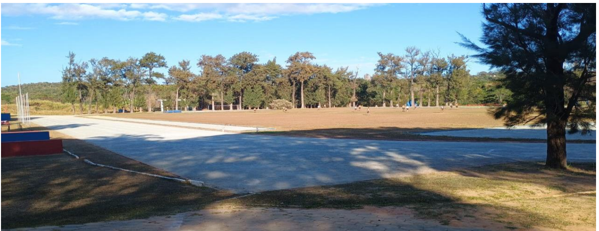
Figura 9: Estádio João do Pulo (campo de futebol e pista de atletismo)