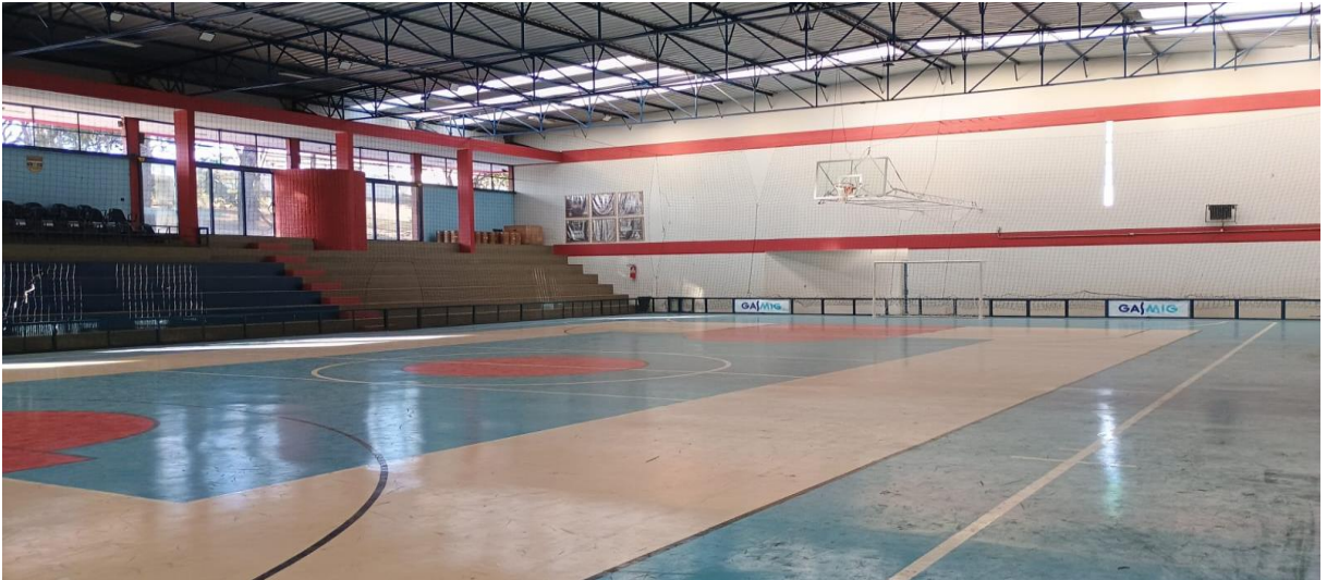
Figura 2 – Ginásio de esportes