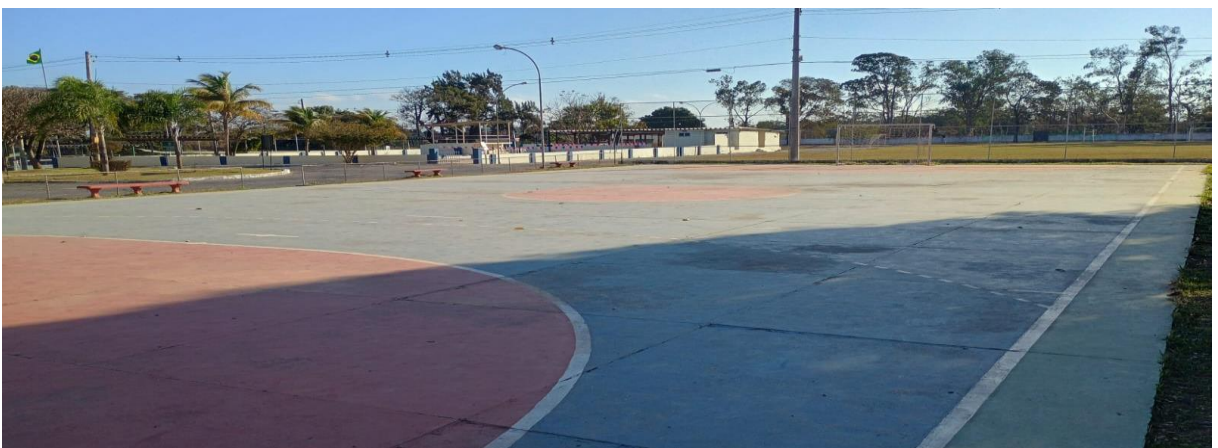
Figura 7: Quadra poliesportiva externa 2