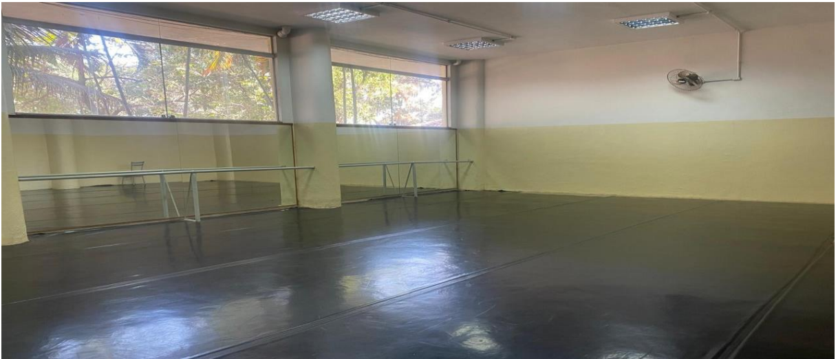
Figura 14: Sala de dança