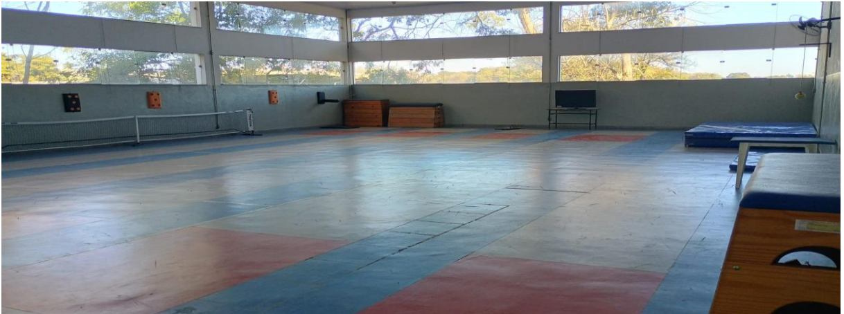
Figura 11: Sala de esgrima