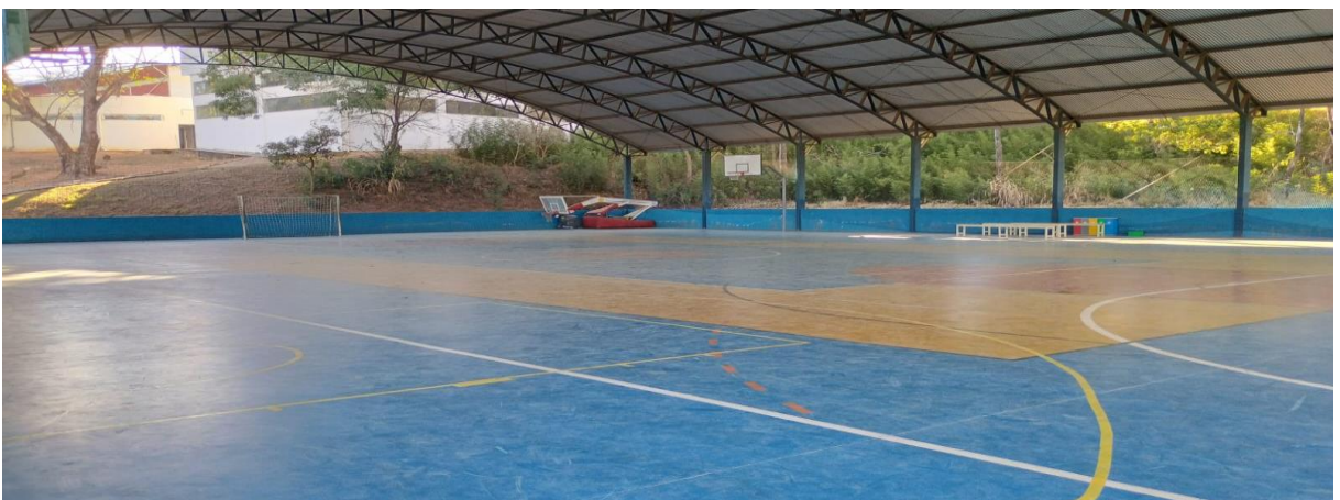
Figura 4 – Quadra poliesportiva coberta 2