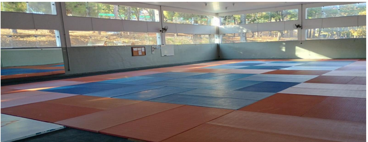
Figura 12: Dojô