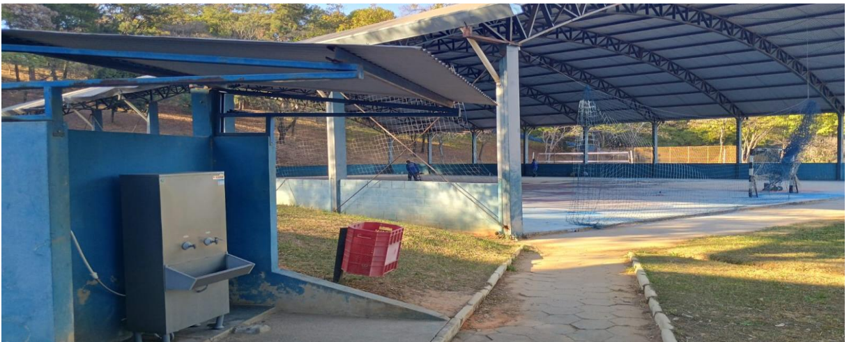
Figura 3 – Quadra poliesportiva coberta 1