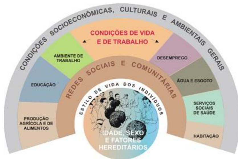
Figura 1. Modelo de determinação social da saúde proposto por Dahlgren e Whitehead

determinantes individuais até uma camada distal onde se situam os macrodeterminantes.