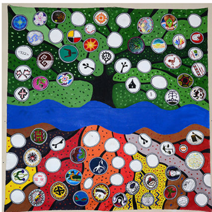
FIGURA 2 – Jaider Esbell, A árvore de todos os saberes , 2013, acrílica sobre tela, 230 x 250 cm.

Reflexão sobre a atividade: Espera-se que o aluno consiga identificar, por meio dos elementos visuais da pintura, relações de causa e consequência. Nesse processo é importante que o professor faça introdução de conceitos como os de crescimento, desenvolvimento e aprimoramento. Novamente, é importante não induzir o aluno a uma interpretação específica.