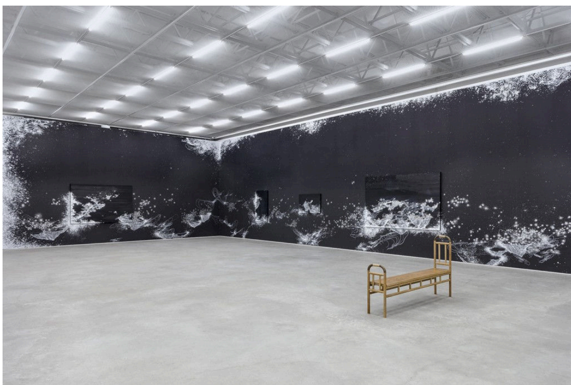
FIGURA 3 – Sandra Cinto, Noturno.

Descrição das atividades a serem realizadas: Questionar os alunos: você sabe o que é uma instalação? Ilustrar a obra da artista é perguntar: isso seria uma instalação? (FIGURA 3). Ao final do debate, passar vídeos com a artista refletindo sobre as suas principais referências artísticas.