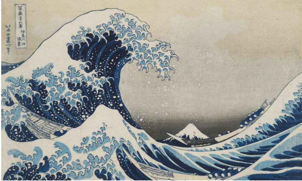
FIGURA 6 – Katsushika Hokusai, A grande onda em Kanagawa (da série de 36 vistas do Monte Fuji), período Edo (1615 – 1868), cerca de 1830-32. Xilogravura policromada; tinta e cor sobre papel.

Fonte: Disponível em: < https://conexaoplaneta.com.br/blog/hokusai-a-grande-onda-que-varreu-o-mundo/ >. Acesso em: 18 maio 2020.