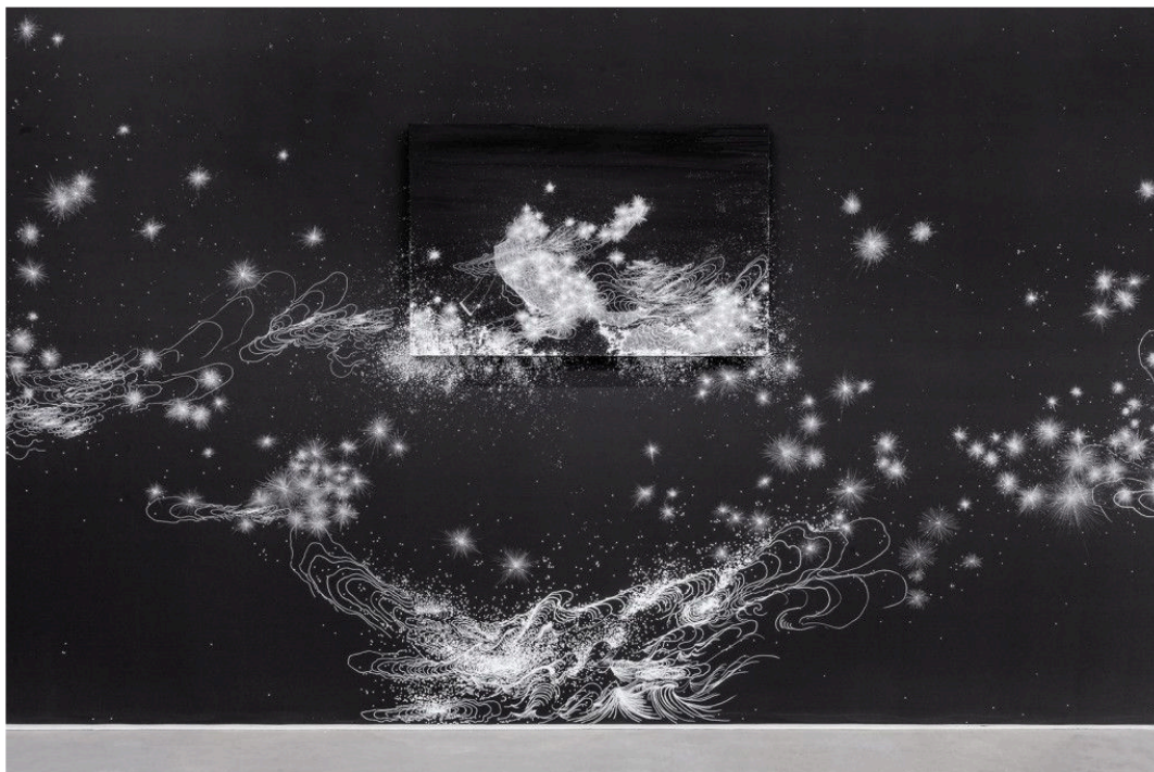
FIGURA 4 – Sandra Cinto, Noturno.

Por meio dessa figura, questionar os alunos se é possível observar alguma forma, objeto ou ambiente (a obra é de modo geral abstrata, mas ainda assim é possível observar formas específicas, como por exemplo, representações que lembram estrelas).