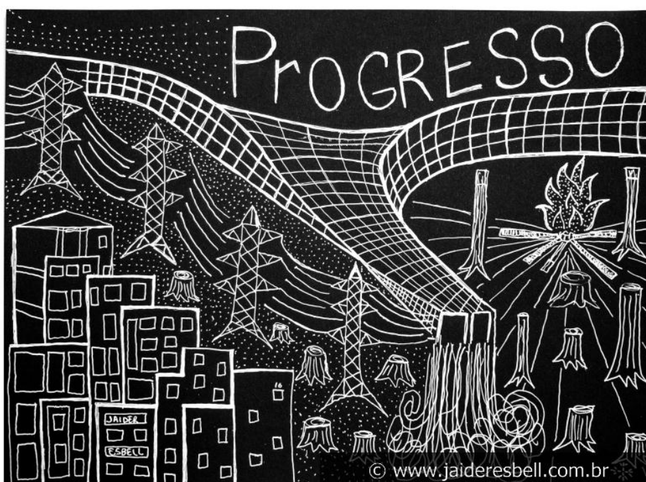
FIGURA 1 – Jaider Esbell, Itwasamazon-01 .

Reflexão sobre a atividade: Espera-se que o aluno consiga identificar elementos visuais na imagem que justifiquem relações de causa e consequência. Nesse processo é importante que o professor não induza o aluno nas suas observações. Durante a atividade diversas interpretações são possíveis: que elementos de um ambiente permitiram a construção/desenvolvimento de outro, que os dois ambientes são inconciliáveis, que os dois espaços são locais tristes e inabitáveis dentre outros aspectos.