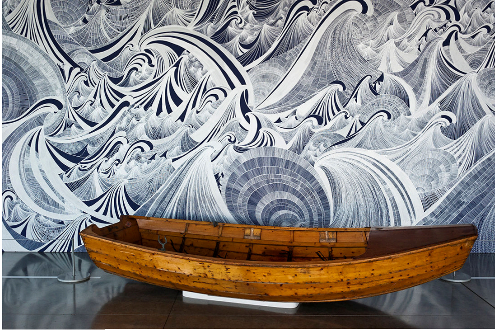
FIGURA 7: Sandra Cinto. Encontro das águas (vista da instalação). Olympic Sculpture Park Pavilion, Seattle Art Museum, Seattle, 2012.