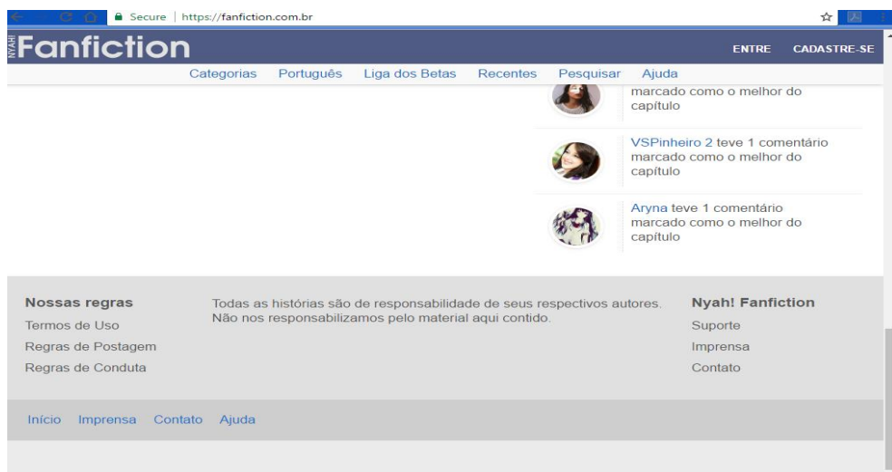
IMAGEM 3