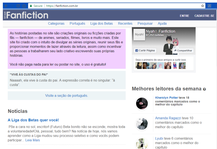
IMAGEM 1-

A seguir, apresento a página inicial do site Nyah!Fanfiction , utilizada nesse projeto para a publicação e apresentação do trabalho final desenvolvido pelos alunos: