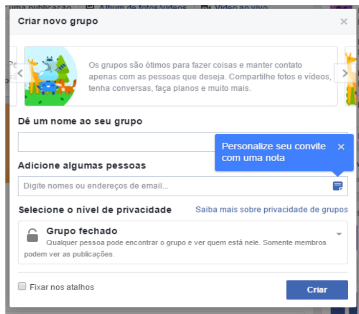
IMAGEM 5

Durante o processo de criação do grupo já é possível adicionar os participantes, basta digitar seus nomes em “adicione algumas pessoas”, veja: