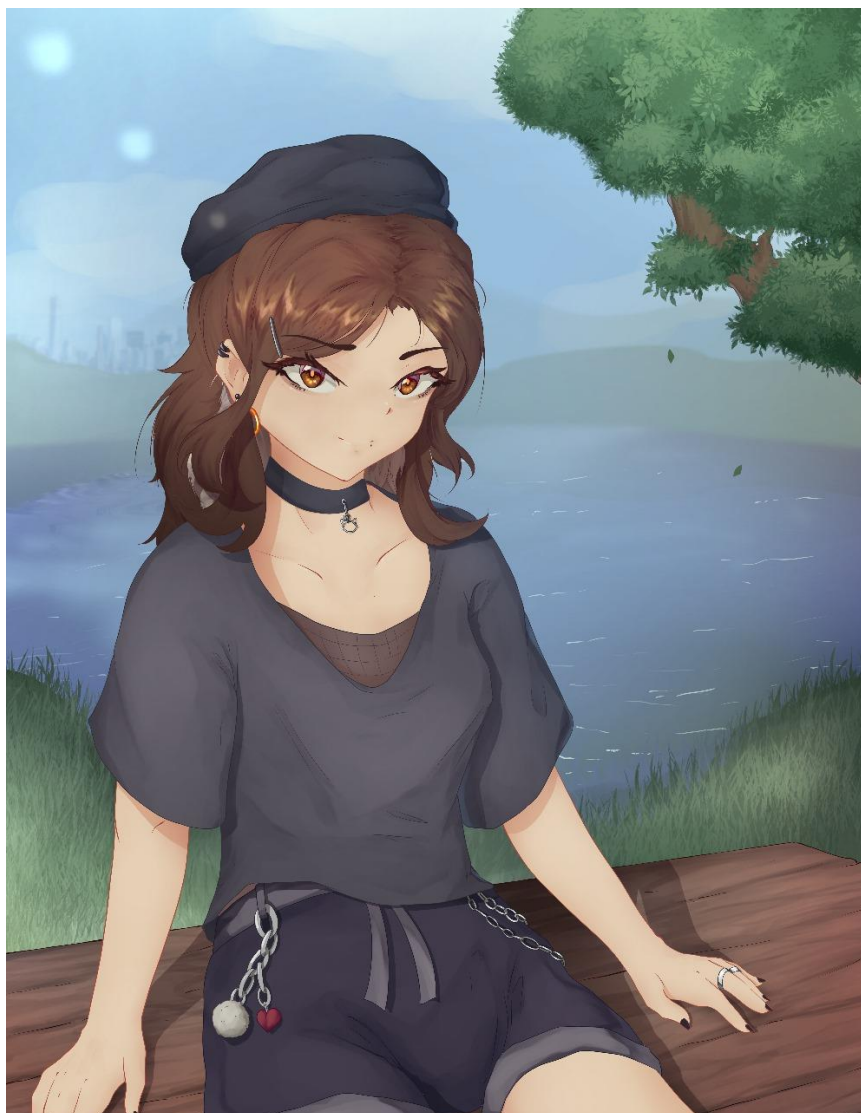
Figura 1 - Autorretrato Rose

ela mostra uma menina meio raposa segurando uma faca no pescoço, e conta sorrindo que era um desenho sobre suicídio. Abaixo segue um autorretrato ilustrado por ela.