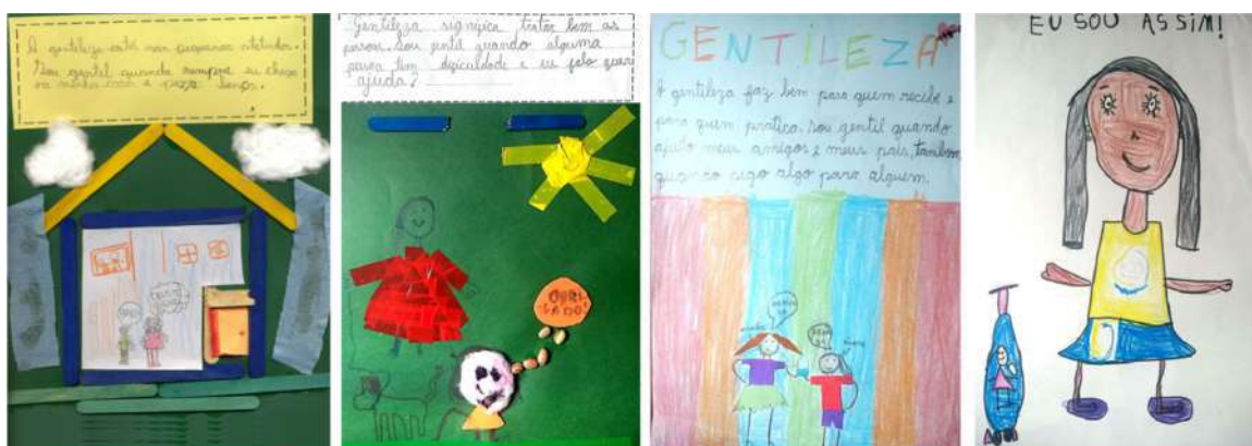
Junho 2018.