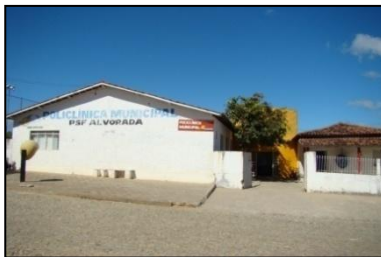
FIGURA 4 - Policlínica municipal Dr. Arnaldo de Carvalho, Jequitinhonha, Minas Gerais, 2009.