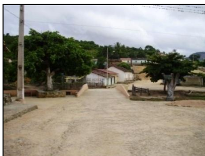
FIGURA 3 - Povoado do Caju, Jequitinhonha, Minas Gerais, 2009.

No que se refere à oferta de serviços de saúde, Caju possui um posto de saúde com uma equipe do Programa Saúde da Família (PSF) que atende à