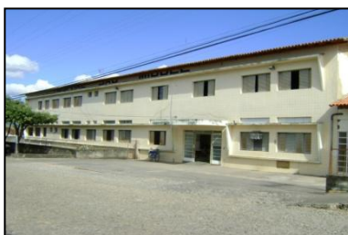
FIGURA 5: Hospital São Miguel, Jequitinhonha, Minas Gerais, 2009.

Em algumas situações, devido às dificuldades geográficas e de transporte para se chegar à sede do município, casos urgentes são dirigidos a centros urbanos mais próximos, como Itaobim e Medina. Pacientes portadores de determinados problemas de saúde são encaminhados pelo programa de Tratamento Fora do Domicílio (TFD), em centros de maiores recursos. Geralmente esses encaminhamentos são realizados para a cidade de Teófilo Otoni, distante 250 km, ou para a capital do Estado.