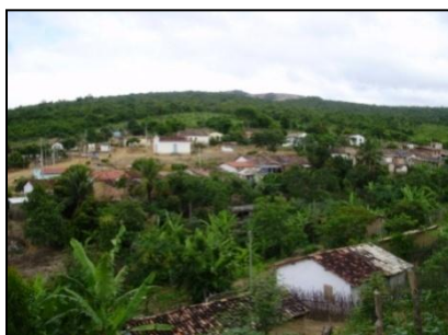
FIGURA 2 - Povoado do Caju, Jequitinhonha, Minas Gerais, 2009.

As casas são, em geral, construções simples feitas de adobe e telha e a maioria possui energia elétrica. A rede de água, com origem em barragens e nascentes próximas, chega à maioria dos domicílios, porém, sem tratamento. A água do córrego que corta o distrito também é utilizada para várias atividades domésticas (FIG. 2 e 3).