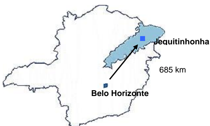
FIGURA 1 – Localização do Município de Jequitinhonha, Minas Gerais, Brasil.

O município de Jequitinhonha, com quase 200 anos de história (fundado em 1811), está inserido na região denominada Baixo Jequitinhonha e situa-se às margens do rio Jequitinhonha. Possui uma extensão territorial de 3.518 Km 2 e uma população de 25.060 habitantes (IBGE, 2009a), sendo que a população residente no meio rural representa aproximadamente 31,0% do total, conforme o Censo 2000 (IBGE, 2000). O Índice de Desenvolvimento Humano (IDH) do município é de 0,668, considerado médio-baixo pelo Programa das Nações Unidas para o Desenvolvimento (PNUD, 2000). As principais fontes da economia local são a pecuária de corte, a agricultura de subsistência e a fruticultura, com ênfase no plantio de bananas. Na produção local destaca-se também o artesanato.