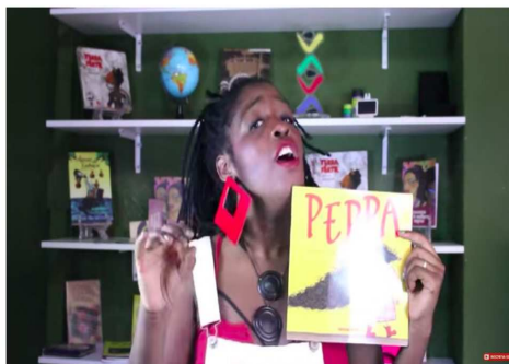
Figura 1. Registro do vídeo “Peppa NÃO! - Resenha”