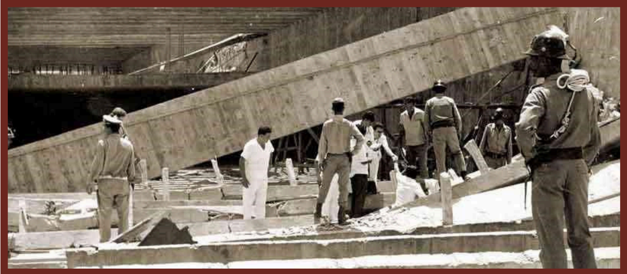
Figura 6 - Parque da Gameleira. Terreno não suportou as estruturas do pavilhão do Parque de Exposições, que desmoronou e deixou dezenas de trabalhadores mortos e feridos.

- Tragédia do desabamento do Pavilhão de Exposições do Parque da Gameleira (em 04/02/1971)[11], que ocupou, por longo período, as páginas dos jornais da época.