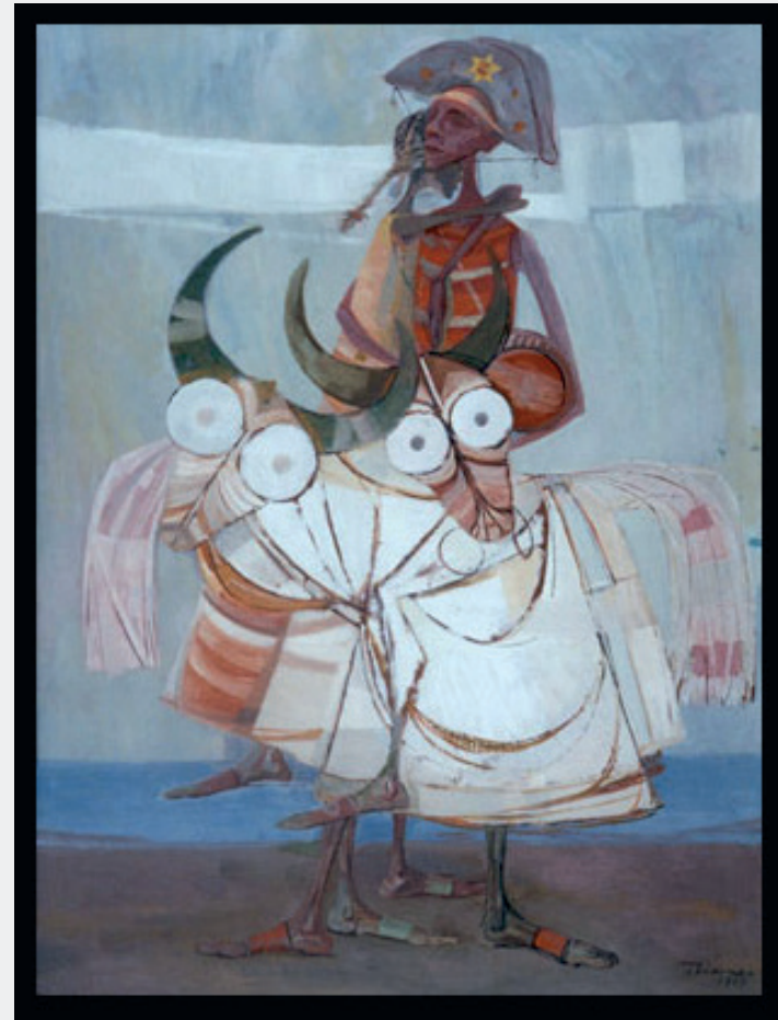
Figura 3: Bumba meu boi 1969. 35cm x 60cm - Óleo Foto: Paulo Bianco Fonte: http://www.enricobianco.com.br/portu/obra.htm