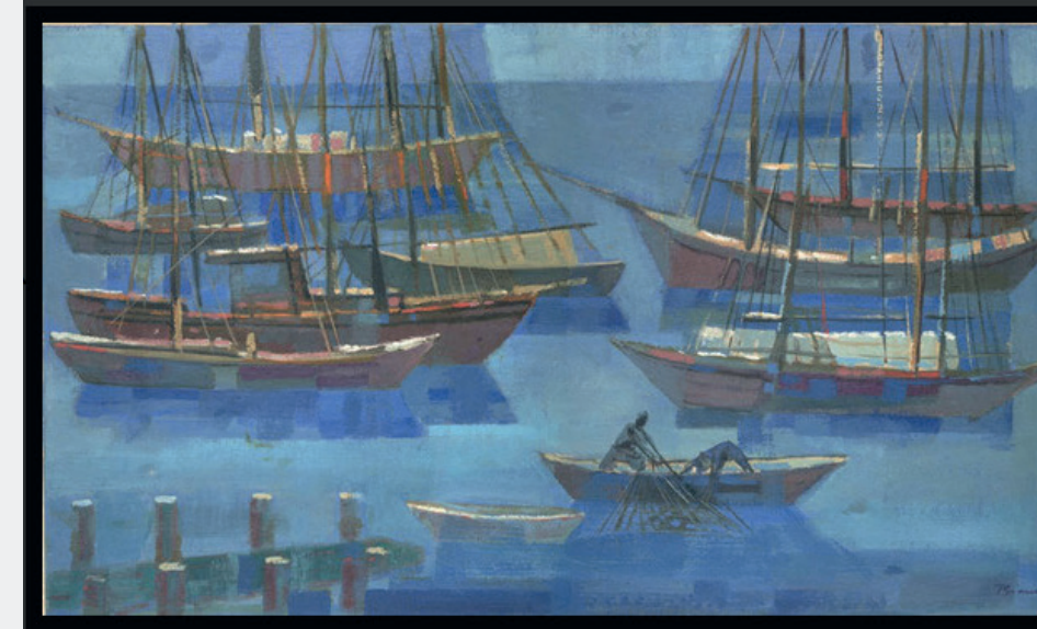
Figura 2: Barcos estudo 1966 39cm x 23cm – Óleo

Por fim, a terceira sugestão (figura 4) é um nu de Bianco no qual podemos visualizar características que podem ser associadas à primeira estrofe do poema “Motivos de Bianco” e, também, ao poema “Ante um nu de Bianco”. A imagem traz o corpo delineado por luz fulva, as pinceladas borradas que criam a atmosfera de sonho e a sugestão de movimento.