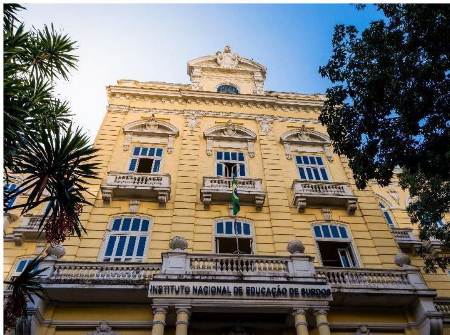
Figura 1 – Instituto Nacional de Educação de Surdos