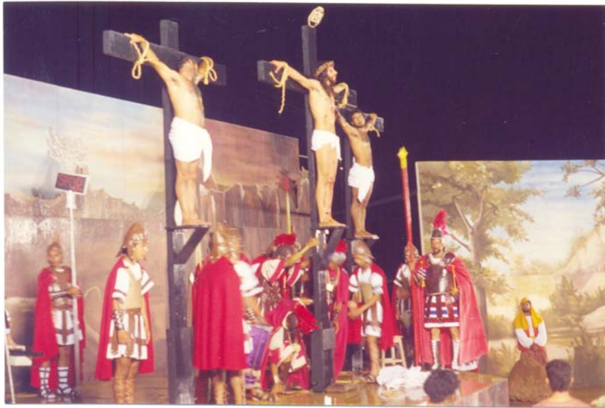
FIGURA 15: Soldados ajustam a cruz de Jesus. Ano de 1993.