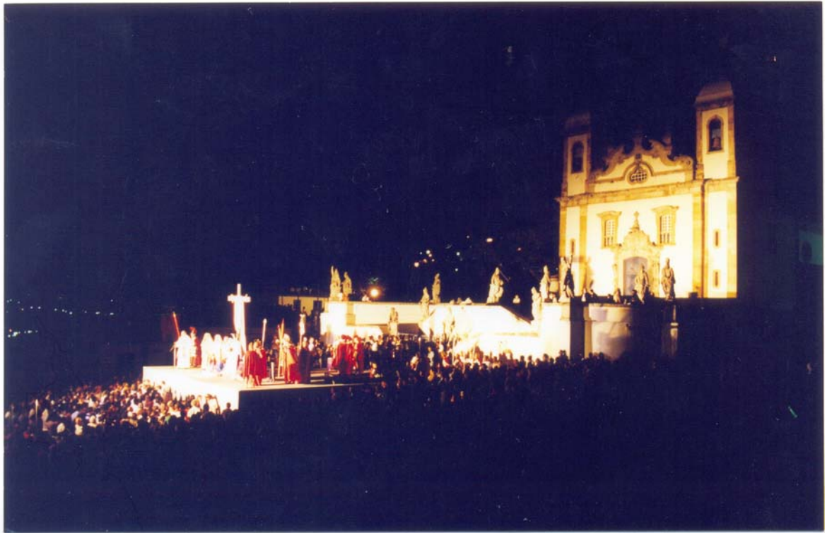
FIGURA 8: Sermão do Descimento, após a Encenação. Visão lateral. Praça da Basílica, ano de 1999.