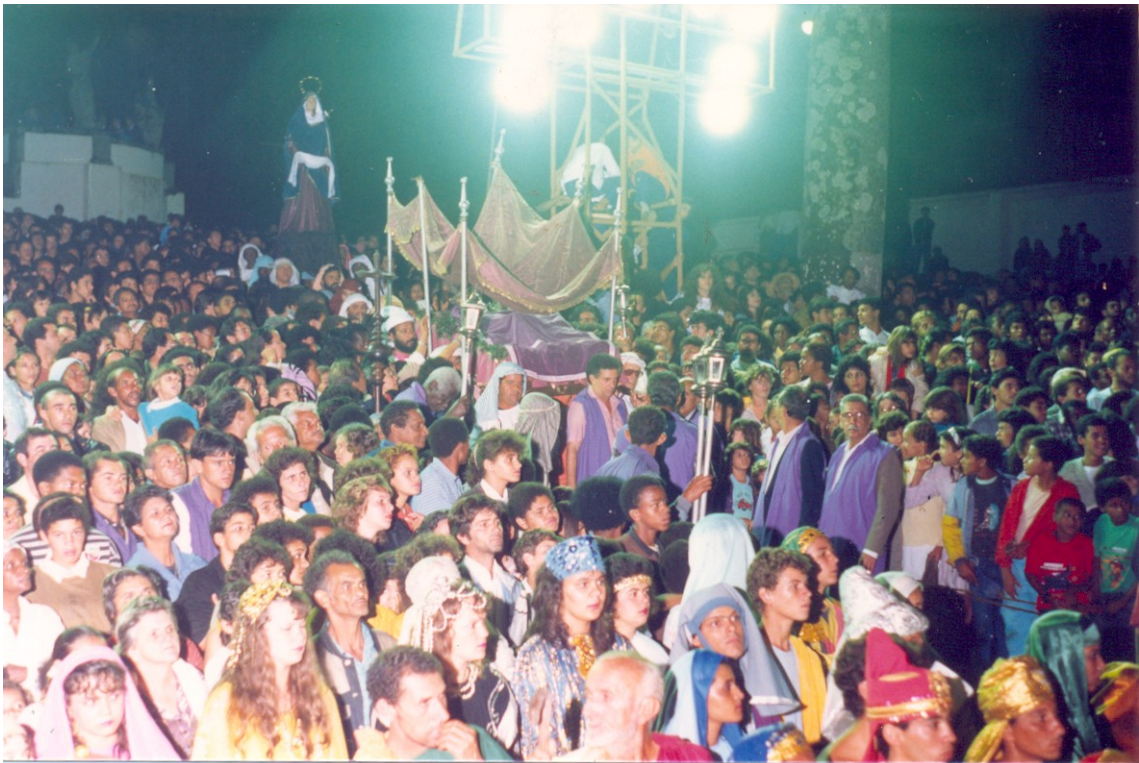
FIGURA 2: Ao final da Encenação, público e figurantes se preparam para a saída da Procissão do Enterro. Ao Centro, os Irmãos do Santíssimo conduzindo o esquife com a Imagem do Senhor Morto seguido da Imagem de Nossa Senhora das Dores. Sexta-Feira Santa, Praça da Basílica, 1991.