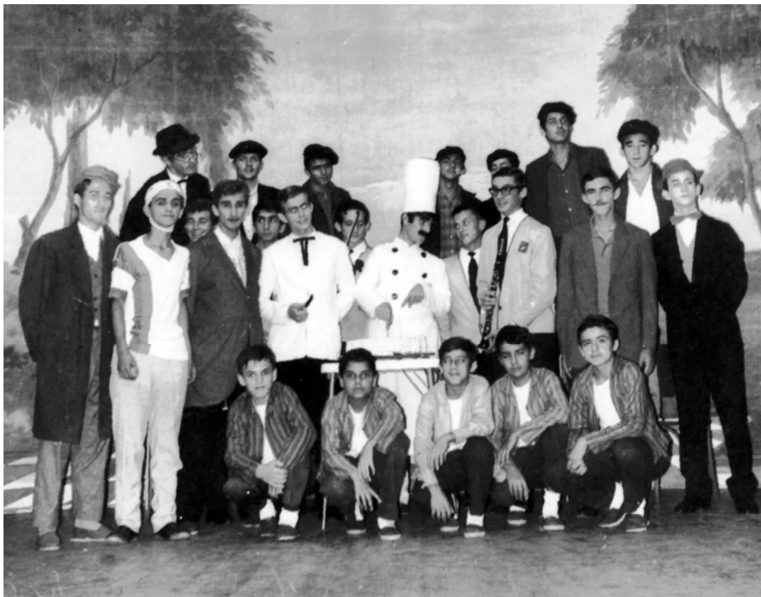
FIGURA 11: Elenco do Espetáculo Dó de Peito (1965), direção: Pe Dalton Barros.