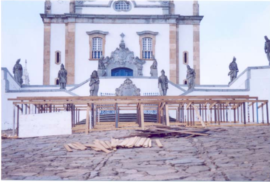
FIGURA 17: Palco 1 em construção - 18/03/2004. Ao fundo, a Igreja Basílica do Bom Jesus de Matosinhos.