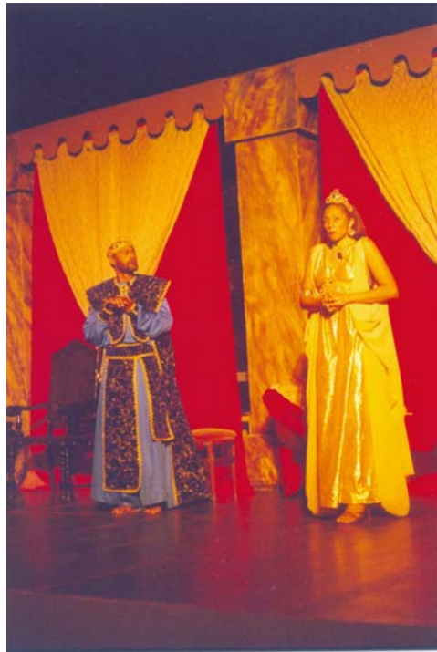
FIGURA 18: Herodes e Herodiades conversando. Ano de 2003.