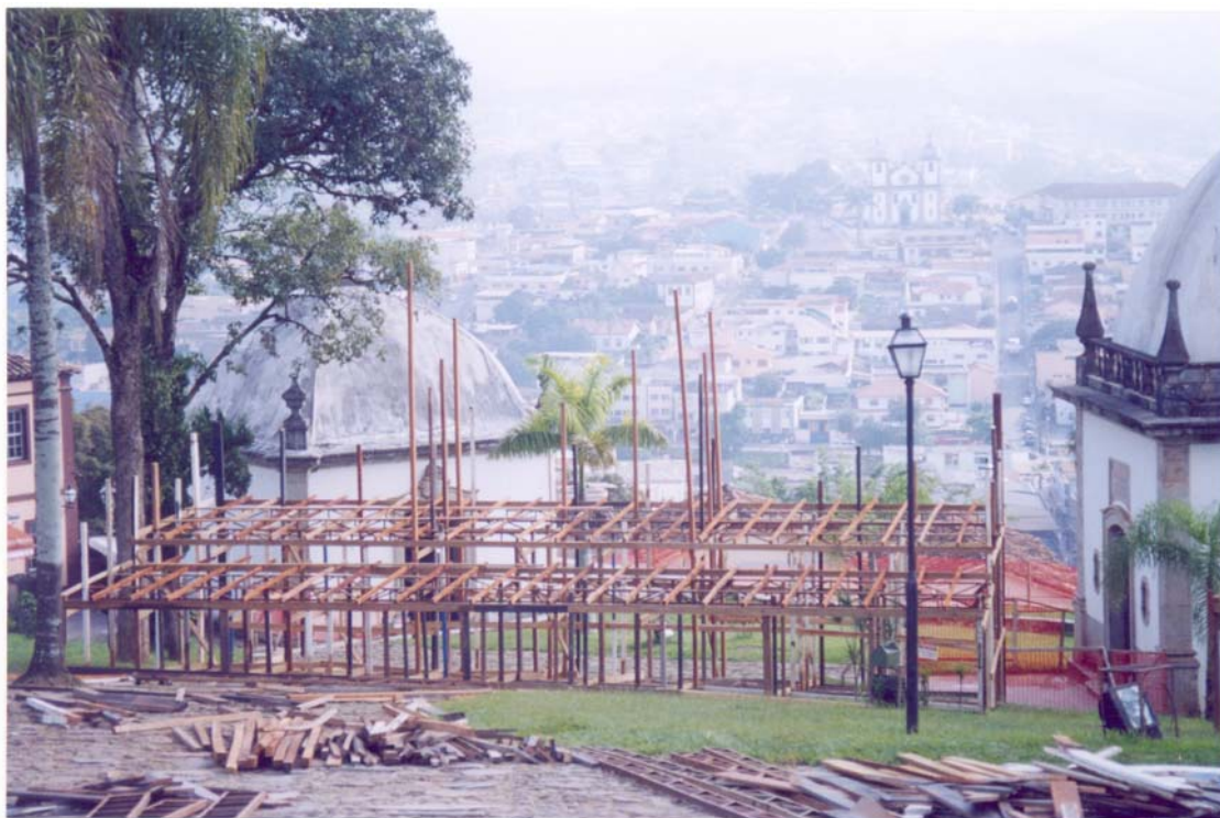
FIGURA 19: Palco 5 em construção - 18/03/2004. Ao fundo, visão da Igreja Matriz de Nossa Senhora da Conceição.

O palco 5, situado ao fundo do Jardim da Basílica, embora tenha a estrutura cenográfica do Palácio de Pilatos construída, compõe também com a vista da Igreja Matriz acima do morro da Matriz. O núcleo histórico da cidade se desenvolveu entre estes dois morros: o da Basílica e o da Matriz e, durante a Semana Santa, a Prefeitura ilumina as ruas que fazem o trajeto da Igreja Basílica à Igreja Matriz: é o caminho das procissões. Podemos ver pela figura 19, de 2004, a Igreja Matriz ao fundo e, no vídeo de 2003, como a encenação é noturna, vê-se o cordão de luzes em zigue-zague colocado pela Prefeitura para as procissões da Semana Santa.