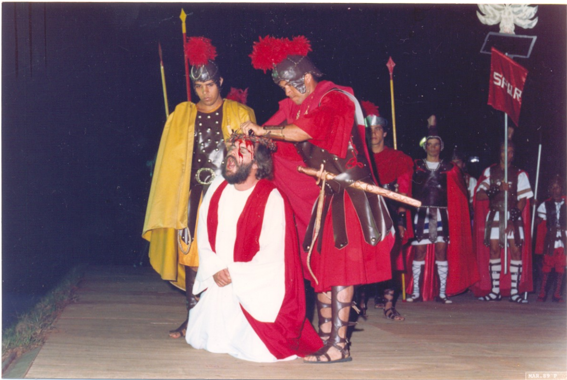
FIGURA 5: Cristo recebendo a coroa de espinhos. Praça da Basílica, ano de 1989.