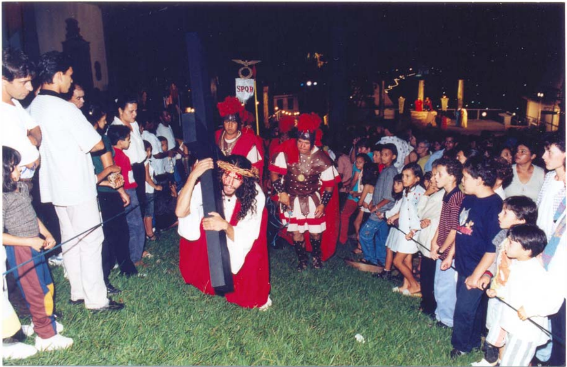
FIGURA 14: Jesus carregando a cruz entre o público até o palco onde será crucificado. Ao fundo e à direita, o palco onde se deu o julgamento. Praça da Basílica, ano de 1999.