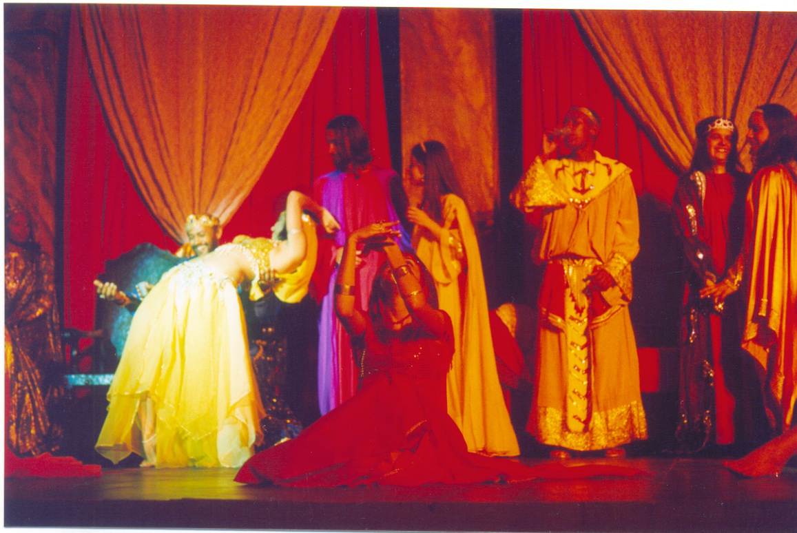
FIGURA 13: Palácio de Herodes. À esquerda, Salomé dançando em sua frente. Praça da Basílica, 2003.

inserção de tantas cenas e da prática da experimentação, a direção do Dez Pra's Oito promoveu o aumento do número dos atores, um redimensionamento do espaço de representação, e a introdução dos telões com a transmissão da filmagem ao vivo.