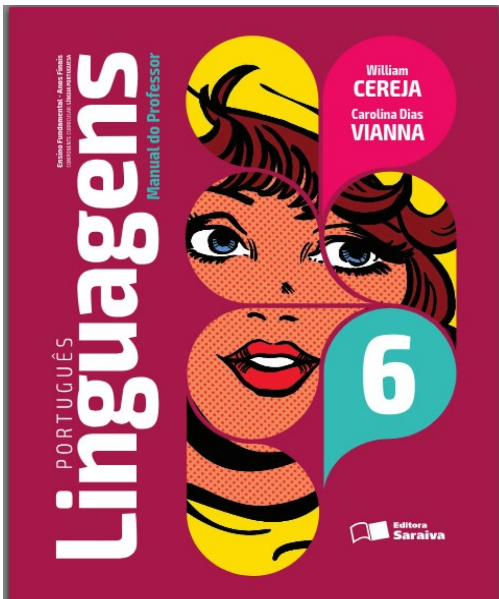
Figura 1: Capa (Fonte: Português Linguagens - 6º Ano – William Cereja e Carolina Dias Vianna). Editora Saraiva, ano 201