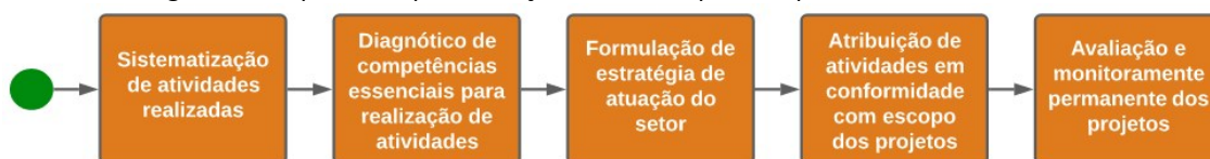
Figura 3 - Etapas na implementação da Gestão por competência e Gestão à vista

Em suma, a iniciativa de incorporar práticas de gestão à vista e de competências foi desenvolvida no RI-UFMG em cinco etapas principais, conforme apresentadas na Figura 3. Isto culminou na construção do quadro no qual consta a relação dos projetos em andamento no setor, suas respectivas equipes, os objetivos estabelecidos, o status de desenvolvimento e o prazo previsto para conclusão.