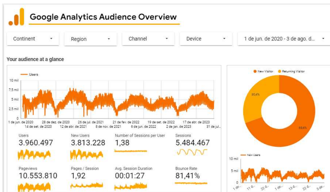
Figura 2- Indicadores de acesso a plataforma do RI-UFMG