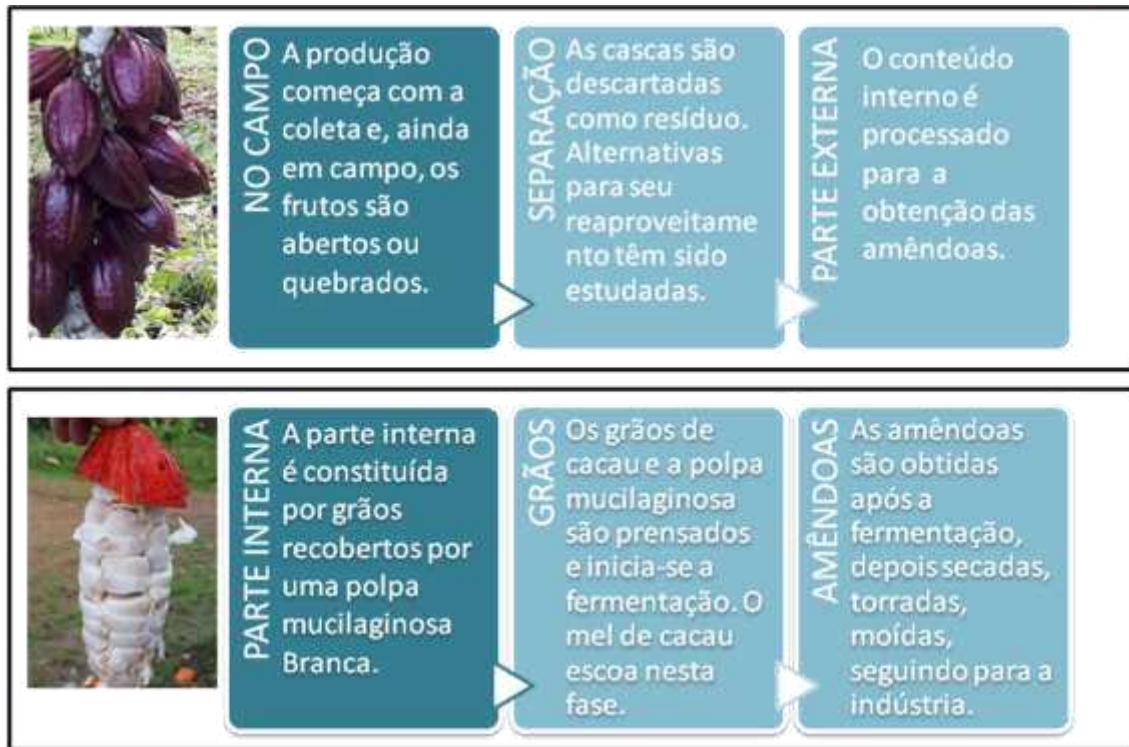
Figura 2 - Processamento do cacau para obtenção das amêndoas secas e do subproduto mel de cacau.

final para fins industriais (Freire et al., 1990). Outro método de extração da polpa utiliza despoldadeira combinada com pulverização de enzimas pectolíticas na concentração de 0,2%, ocorrendo diminuição da viscosidade e aumento do rendimento devido à quebra da pectina, além de aumento da concentração dos açúcares (Freire et al., 1990).