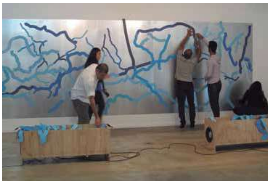
Figura 3: Repaisagem. Instalação (caixas de madeira, alto-falantes, chapas de zinco), 2.00 x 6.00 x 3.00m, 2010.

[A] dinâmica entre visíveis-invisíveis é também o ponto de partida para Repaisagem. Uma paisagem que, assim como as demais, é construída pelos agenciamentos sociais, culturais, estéticos e políticos, mas redesenhada e redefinida pela participação do público que, tomando trajetos e derivas, desenvolve uma imaginária bacia hidrográfica pautada em fragmentos recortados do real. Enquanto isso, pode-se ouvir os sons de rios ocultados na paisagem urbana. Paradoxo de uma situação limítrofe entre o que está ali e não se pode mais ver, contraposto ao que vemos em representação tomado como ponto de partida para uma recriação.