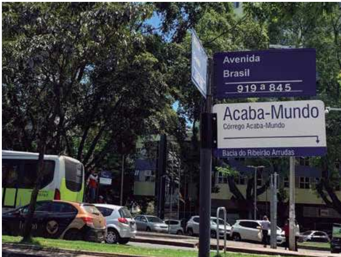
Figura 6: “Sobre o Rio”. Intervenção urbana, aproximadamente 230 placas de aço (2018-2020).

fortes chuvas, e vários dos córregos da cidade transbordaram, causando grande transtorno e muita destruição. Esse evento trouxe um impacto inesperado ao “Sobre o Rio”: quando iniciamos a instalação das placas – particularmente, com a sinalização do Córrego do Leitão em um dos locais mais castigados pela enchente do mês anterior, a suposição de muitos transeuntes foi de que se tratava de uma ação da prefeitura, em reação ao ocorrido. Era como se, com aquelas placas, a prefeitura alertasse a população sobre a presença dos córregos e, conseqüentemente, sobre o risco de enchentes em períodos de chuva forte. Ficou claro também, naquela ocasião, que o interesse jornalístico em relação ao projeto se ampliou por sua (inesperada) associação com as recentes enchentes na cidade. Curiosamente, a divulgação pública de “Sobre o Rio” nos veículos de comunicação (jornais, TVs e sites locais e nacionais) se deu muito mais pelas pautas ligadas ao cotidiano das cidades do que pelas pautas de Arte e Cultura. De certa maneira, isso foi um indicativo de que o trabalho havia “furado a bolha”, tal como desejávamos, dialogando com um público mais amplo, para além do circuito especializado das artes e da cultura. Em fevereiro e março de 2020, foi possível instalar a maioria das placas de sinalização dos córregos previstas no projeto (figura 6). No entanto, antes de concluirmos todo o processo, a instalação teve que ser interrompida, dado o fechamento da cidade em virtude da pandemia de COVID-19.