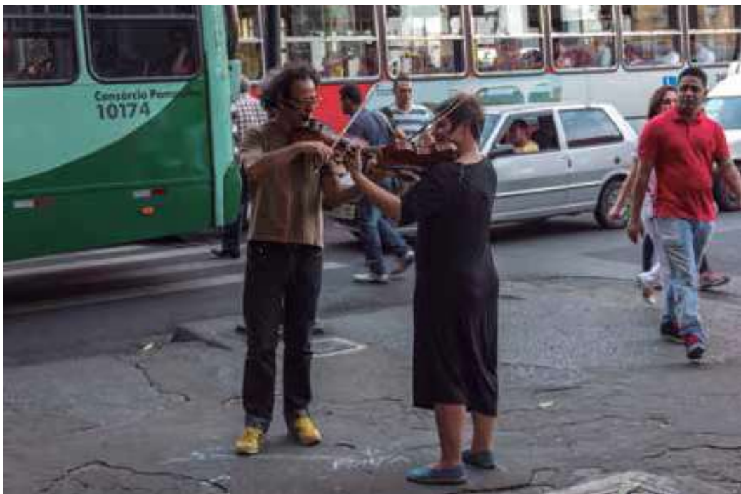
Figura 4: Lição: se essa rua fosse um rio. Performance, aprox. 60 minutos, 2011-2016.