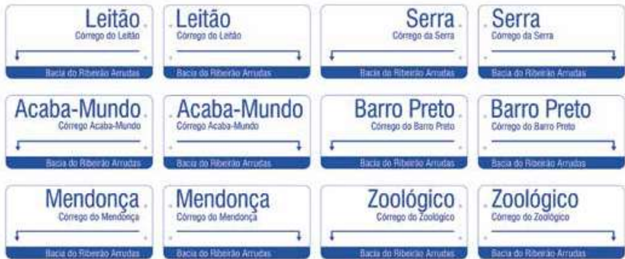
Figura 5: Modelos das placas da intervenção urbana “Sobre o Rio” (2018-2020).

terial, cores, fontes e acabamento. No entanto, inverti as cores da placa – fundo branco e texto azul – de modo a criar uma diferenciação e um contraste em relação às placas existentes (ver figura 5).