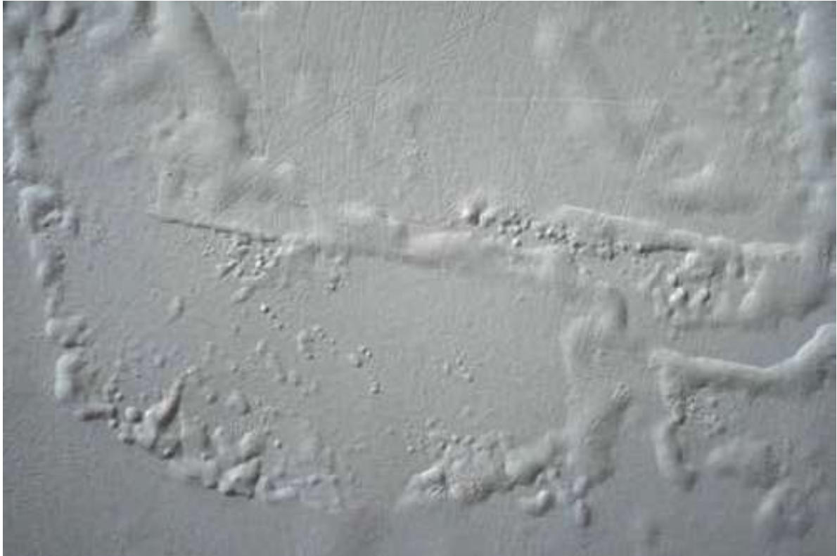
Figura 1: Mapa Mofo. Vídeo, 12 minutos, 2012.

Lentamente, (...) os mapas formados pelo bolor conduzem uns aos outros, paulatinamente alterando e expandindo, fronteiras. O branco ganha tons ocre, o plano adquire volume: o rio se insinua por entre tijolos e massa corrida, como se desenhasse seu se desenhasse seu próprio percurso.