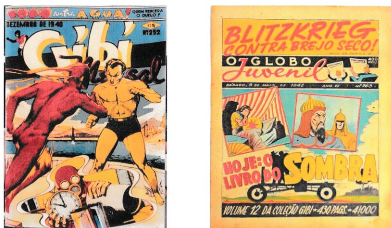
Figura 2 - Capas das edições dos anos 1940, das revistas Gibi Mensal e O Globo Juvenil