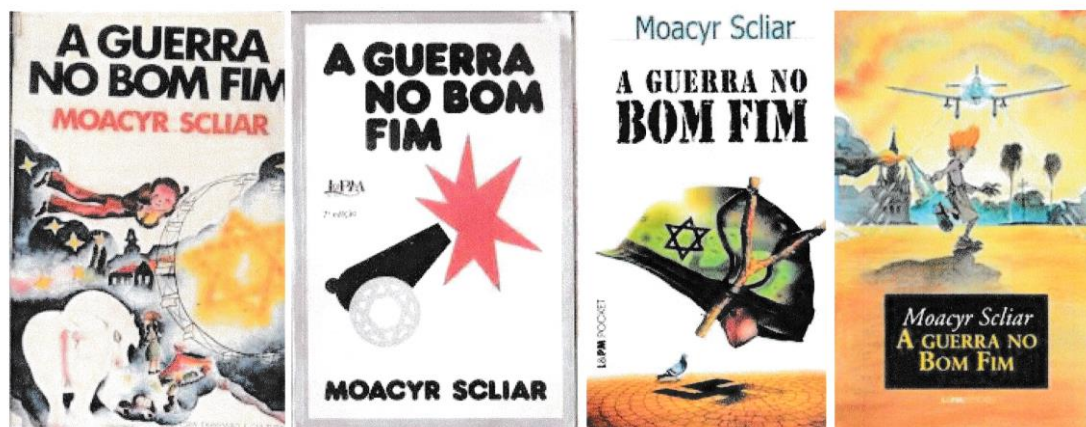
Figura 1 – Capas das edições de A guerra no Bom Fim