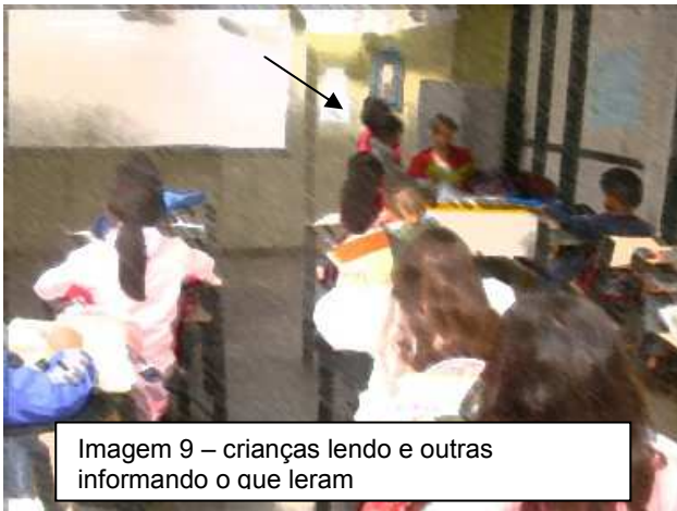
Imagem 9 – crianças lendo e outras informando o que leram