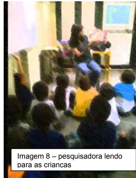
Imagem 8 – pesquisadora lendo para as crianças