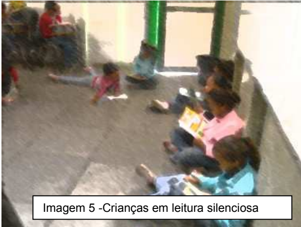
Imagem 5 -Crianças em leitura silenciosa