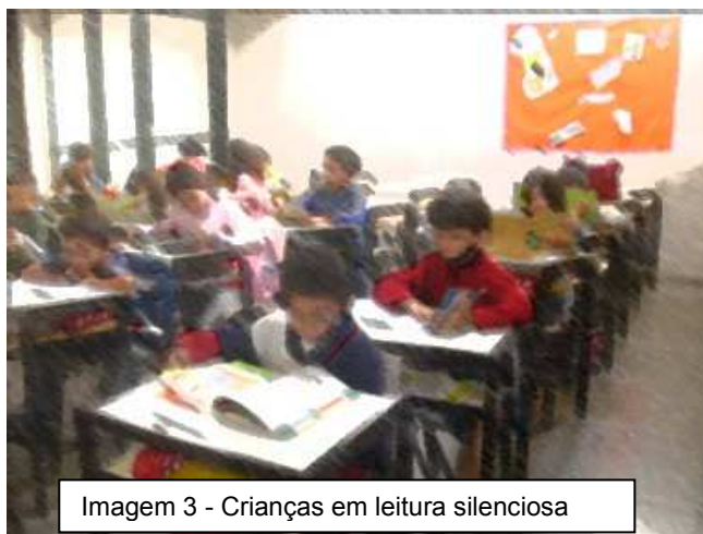
Imagem 3 - Crianças em leitura silenciosa