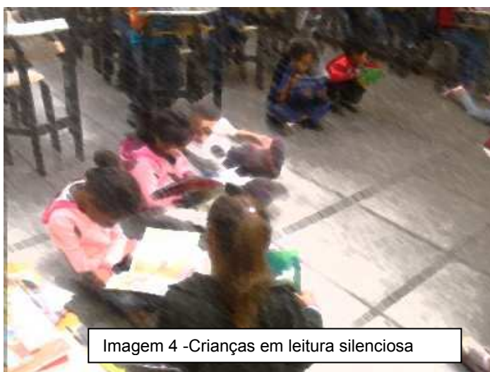
Imagem 4 -Crianças em leitura silenciosa