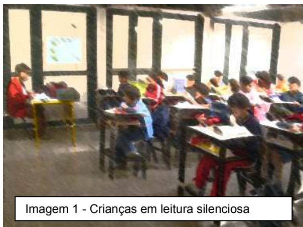
Imagem 1 - Crianças em leitura silenciosa