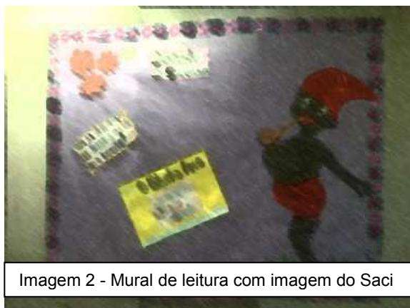
Imagem 2 - Mural de leitura com imagem do Saci