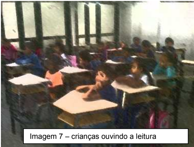
Imagem 7 – crianças ouvindo a leitura