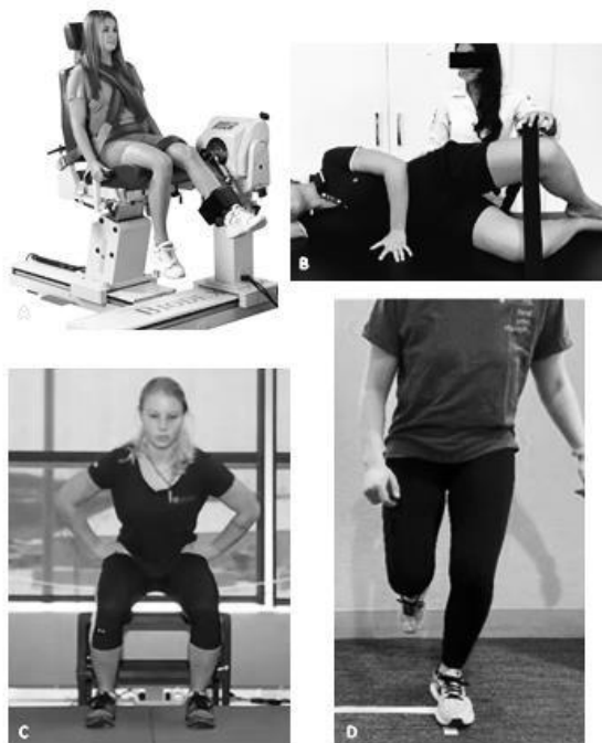
Figura 1: Testes clínicos utilizados na avaliação pré-temporada presentes na análise CART. Isocinético Isquiotibiais (A); Hip Sit (B); Counter Movement Jump Test (C); Hop Test (D).