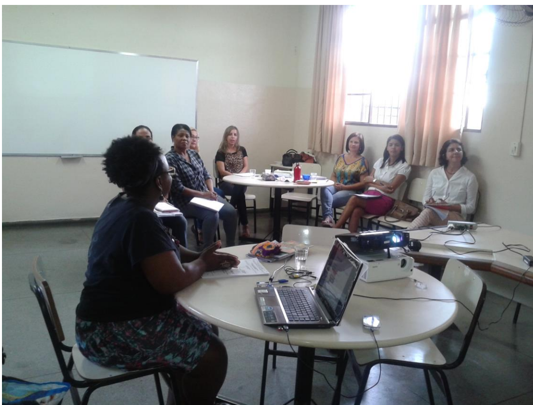
FIGURA 3- Professoras em formação