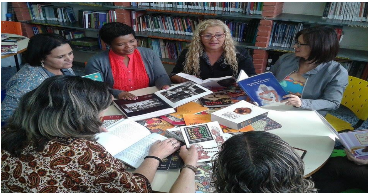
FIGURA 2 – Reunião da comissão na biblioteca da escola