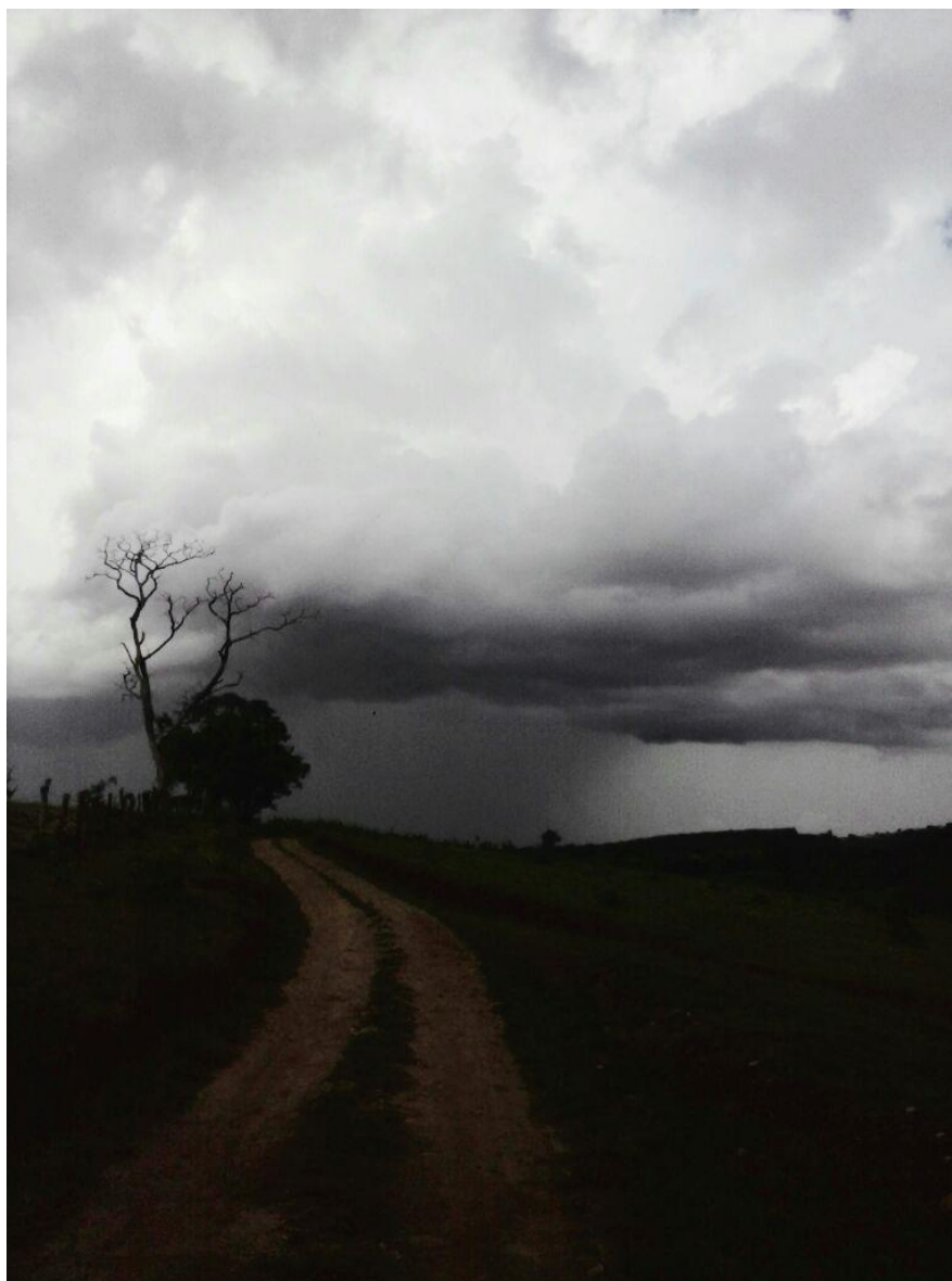
Figura 11 – Fotografe com a sua alma