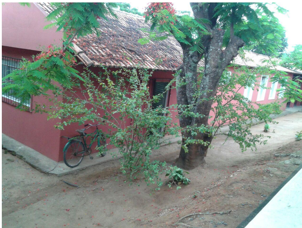
Figura 13 – A arte que está na natureza