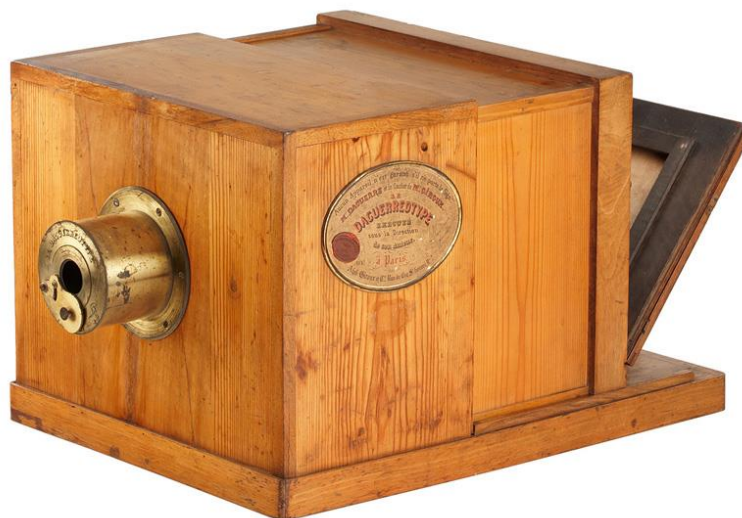
Figura 1 – Máquina do Tempo: Daguerreótipo