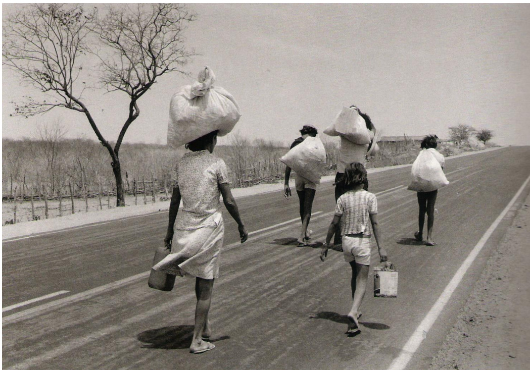
Figura 4 - A migração rural para as grandes cidades