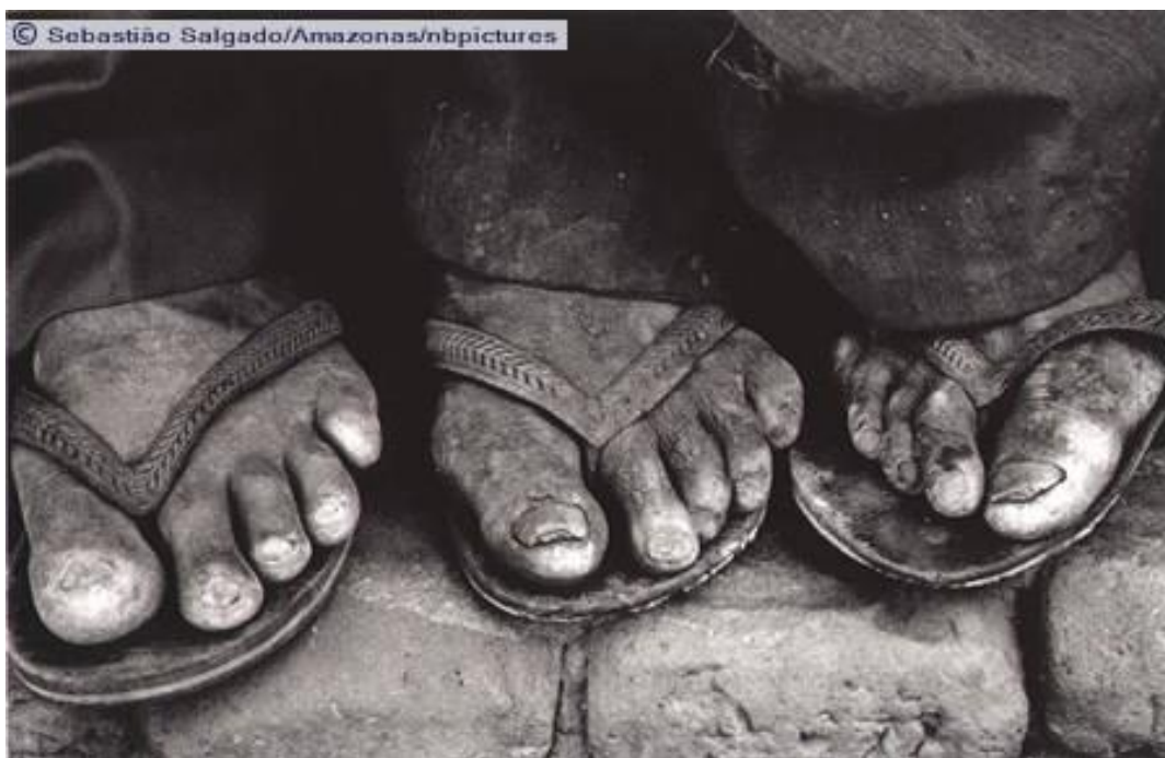
Figura 5 - Os pobres trabalhadores da terra