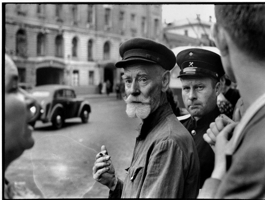
Figura 3 - SOVIET UNION. Russia. Moscow. 1954.