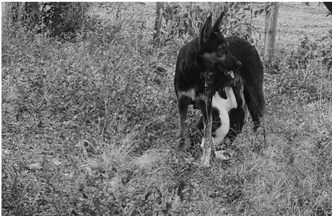
Figura 7 – A natureza do ponto de vista mais belo