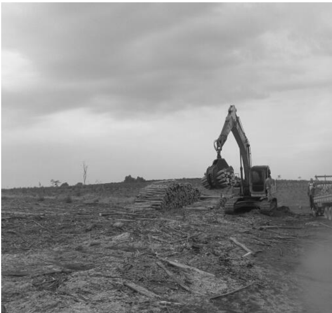
Figura 9 – A ação do homem