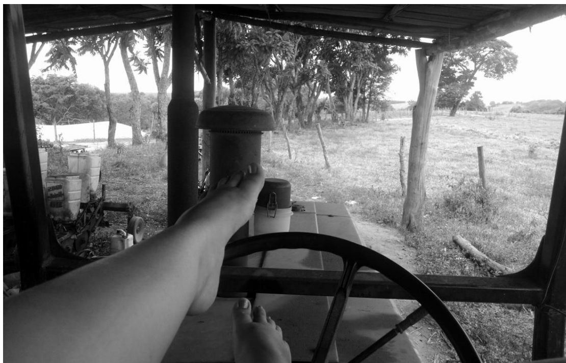
Figura 8 – A natureza do ponto de vista mais belo