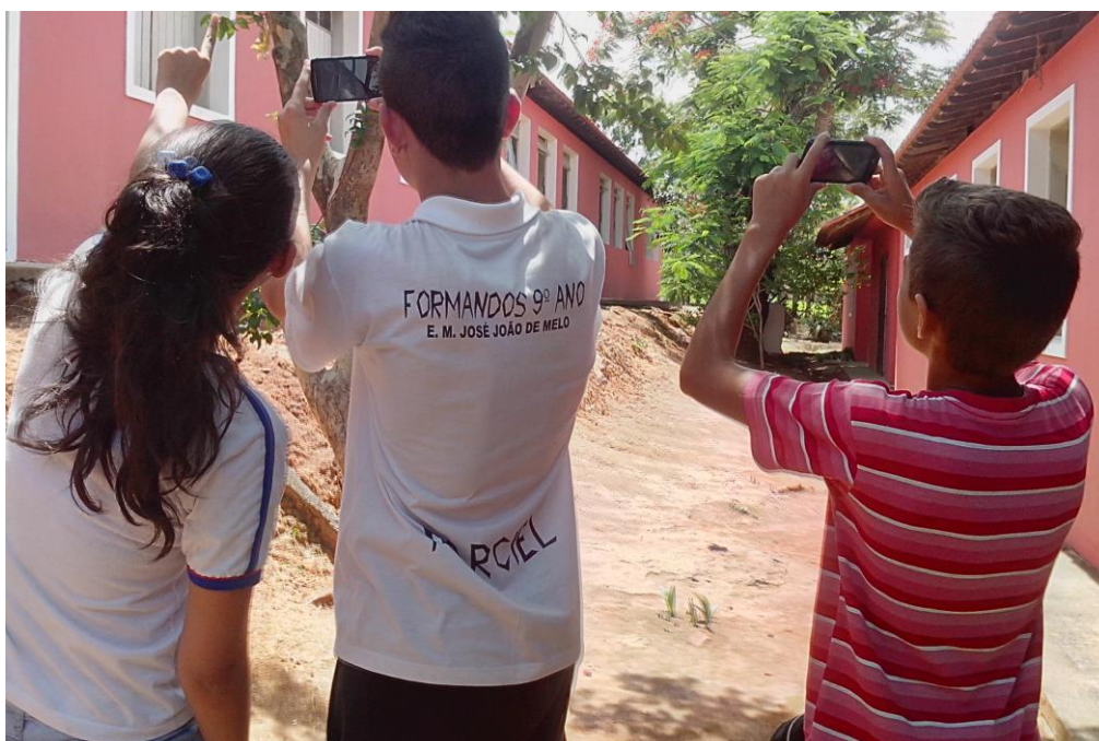
Figura 12 – Oficina de Fotografia