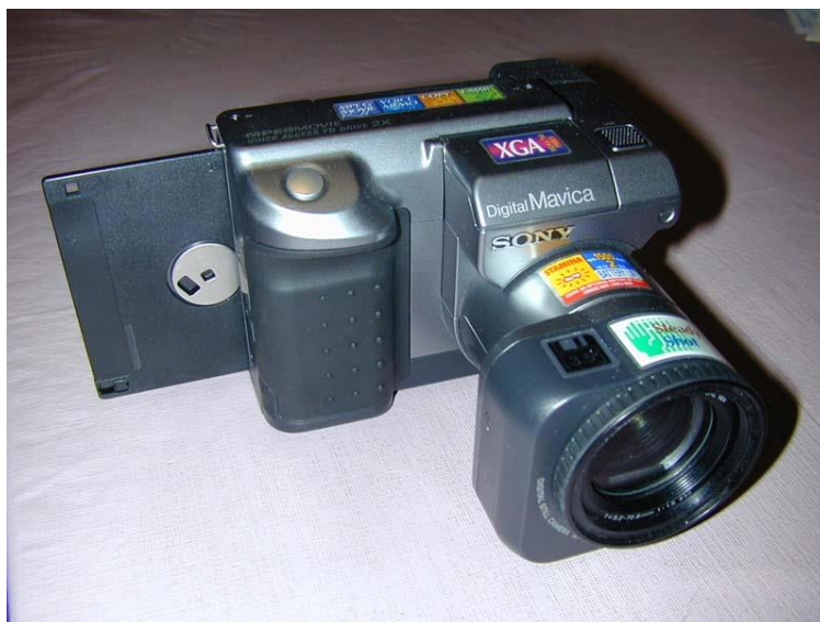
Figura 2 - Câmera fotográfica digital Mavica