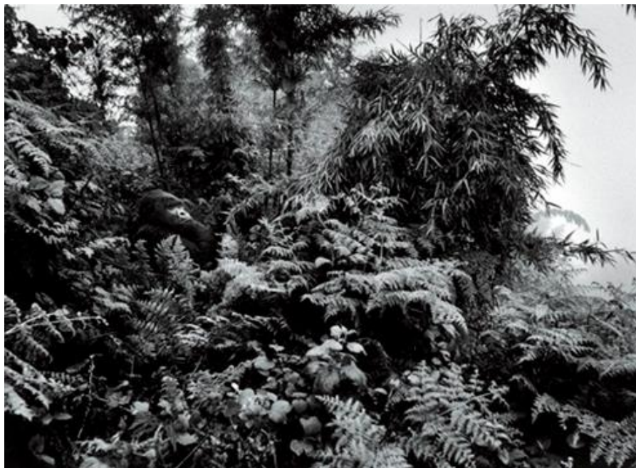
Figura 6 – Gorila da montanha: Floresta no Monte Sabyinyo, Parque Nacional do Virunga, Ruanda, 2004