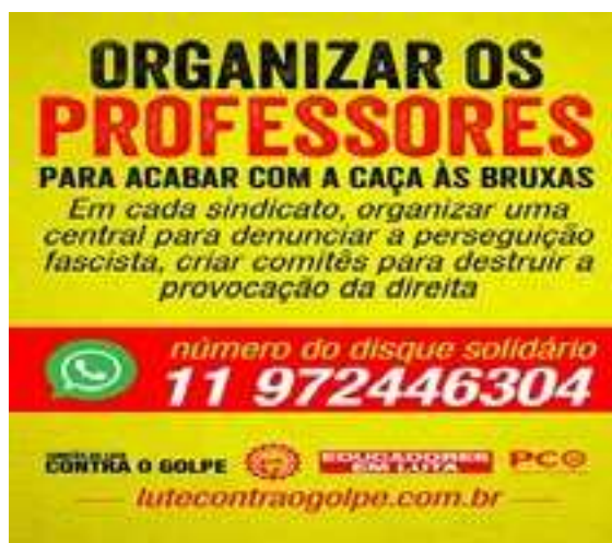
Figura 2 – Campanha de organização sindical das professoras e resistência à censura em sala de aula

Sindicatos e organizações civis também se mobilizaram, apontando a ilegalidade da coerção de docentes e da interdição de certos saberes. Alega-se que as propostas de censura e de coibição da docência são inconstitucionais, já que ferem o Artigo 5º da Constituição de 1988, que rege sobre a liberdade de expressão; e o Artigo 205º, sobre a regulamentação da educação (Figura 2).