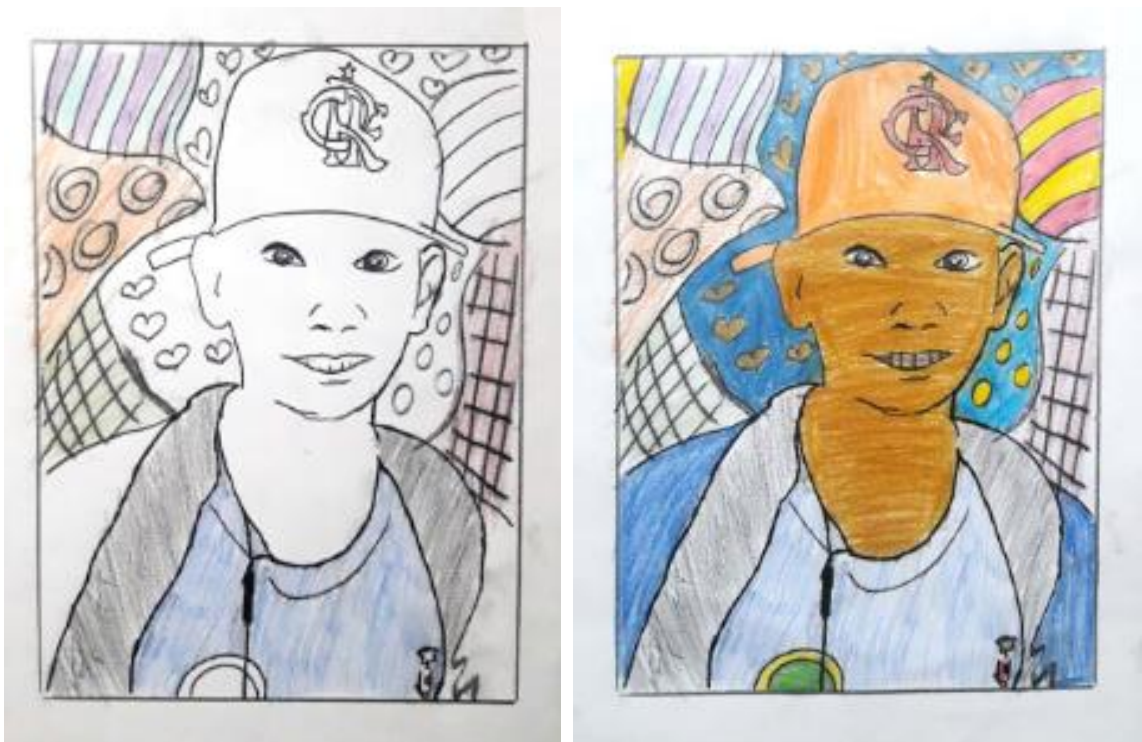
Figura 3 – Autorretrato realizado por aluno. Pintura a lápis de cor sobre traçado de carbono. 210mmX297mm.