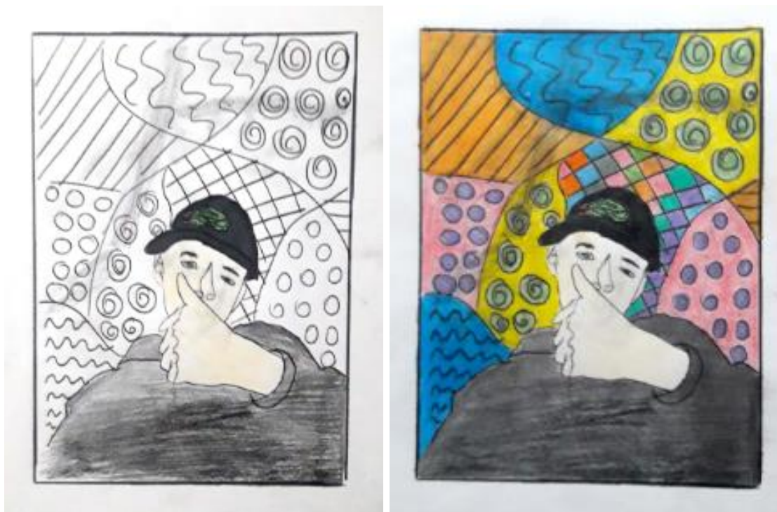
Figura 4 – Autorretrato realizado por aluno. Pintura a lápis de cor sobre traçado de carbono. 210mmX297mm.

E por último, não poderia deixar de citar a realização de uma atividade sobre vanguardas europeias, aplicada para alunos do terceiro ano do ensino médio. Foi realizado um trabalho em grupo, após uma aula expositiva e cada grupo de alunos ficou responsável por pesquisar conteúdos com tópicos predefinidos e aplicar a aula sobre cada vanguarda, intermediando um debate caso houvesse questionamentos.