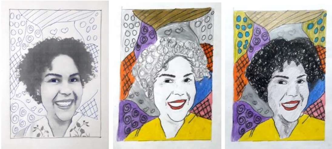
Figura 2 – Autorretrato realizado pela professora, exemplificando a tarefa a ser feita. Pintura a lápis de cor sobre traçado de carbono. 210mmX297mm.