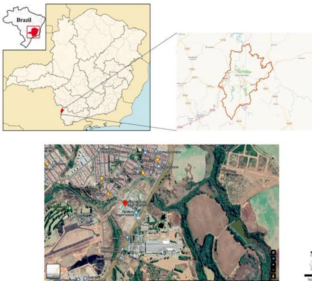
Figura 1 – Localização do Estado de Minas Gerais e do município de Poços de Caldas (em vermelho, acima a direita). Abaixo, vista aérea do IFSULDEMINAS - Campus Poços de Caldas (marcador em vermelho).

A coleta das plantas para a construção do herbário de referência do IFSULDEMINAS, localizado na Zona Sul de Poços de Caldas (46° 33' 39" Oeste, 21° 47' 16" Sul) (Figura 1), se deu de agosto de 2019 a junho de 2020, em um raio de 500 m ao redor do meliponário existente na instituição. Essa atividade fez parte do projeto de pesquisa intitulado “Análise da interação entre abelhas sem ferrão e plantas por meio de recursos polínicos” desenvolvido durante o Curso de Graduação em Ciências Biológicas dos dois primeiros autores.