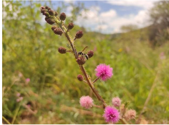
Figura 2 – Espécime de Fabaceae com flores róseo-lilases em floração no período de março de 2020, ocorrente no IFSULDEMINAS, Campus Poços de Caldas, Minas Gerais.

em caderno de campo as informações sobre o ambiente onde foram coletadas as plantas, seus hábitos (modo de vida) e detalhes sobre sua morfologia, como as particularidades das flores, coloração das pétalas e sépalas, se apresentavam odor, dentre outras características, procurando-se sempre fotografá-las em campo (Figura 2).