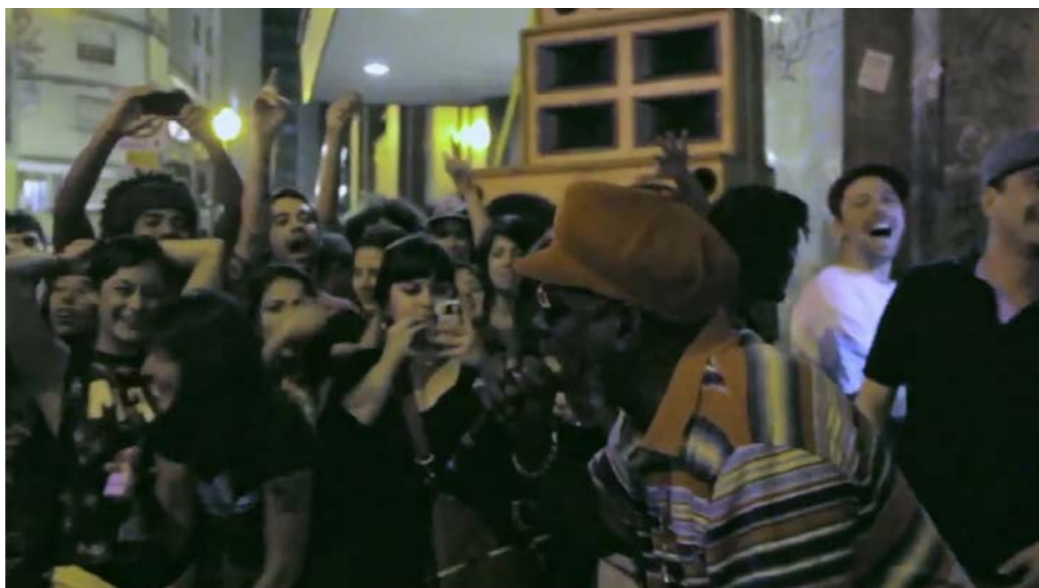
1. Frame de Sound System: a Voz da Quebrada – Johnny Osbourne faz a “galera” explodir no centro de SP. Ao fundo, os alto-falantes.

O ponto de escuta produzido nesse segmento de SSVQ é o de alguém no meio desse público, não o ponto de escuta genérico do espectador abstrato na sala de cinema, diante do computador ou da TV, favorecido pela inserção de canções na montagem, como na maior parte do filme. O som direto faz com que a montagem sonora amplifique o nível energético ao mais alto patamar no documentário, algo que também acontece na segunda vez em que o som gravado in loco é trabalhado, na session do coletivo Feminine Hi Fi, com a performance da cantora Laylah Arruda. Tais momentos de alta concentração energética são também os momentos que inspiram maior expectativa de veracidade.