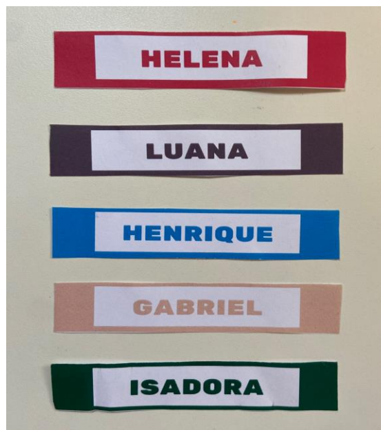
Figura 3. Nomes dos/as colegas da turma na mesma cor da página do álbum

Em etapa posterior, após a utilização repetida deste álbum em diversos momentos, focalizamos o nome escrito, como objeto de conhecimento a ser explorado. Foram apresentados os nomes dos estudantes em fichas separadas, ao lado do álbum, na mesma cor em que aparecia nele, como se pode ver na Figura 3 . Buscou-se, então, responder às seguintes perguntas: Mel é capaz de reconhecer os nomes escritos no álbum? Quais critérios ela usa? A cor? As letras iniciais? Uma leitura global do nome?