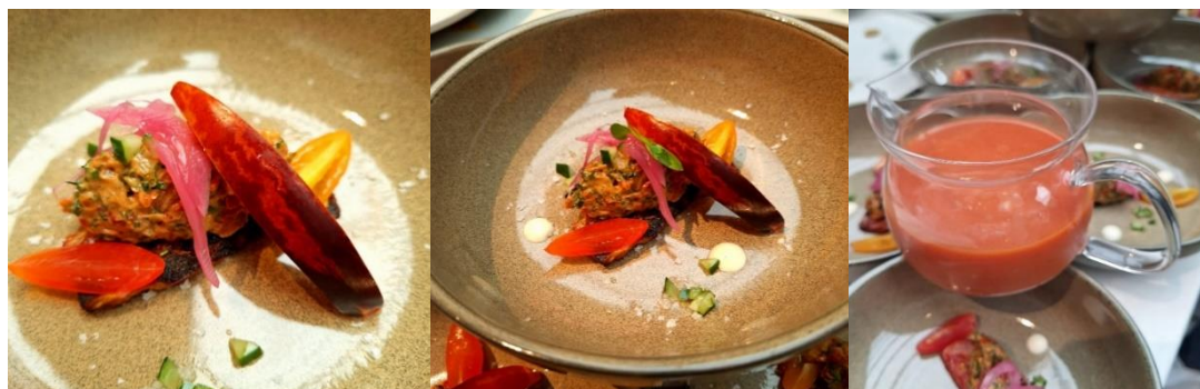
Figura 2 - Sopa fria de tomates