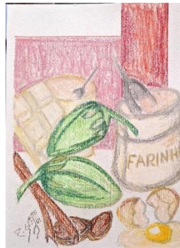
Figura 15 - Sobremesa