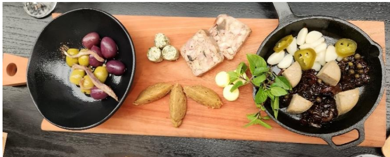
Figura 1- Couvert

Patê de campanha, mousse de fígado de frango com pimenta-verde e chutney de passas, manteigas e azeitonas temperadas, pão.