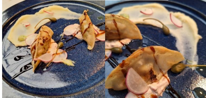
Figura 6 - Guioza de lingua