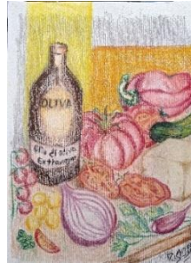
Figura 12 - Primeiro prato