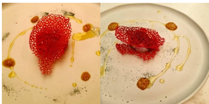
Figura 3 - Bacalhau mi-cuit