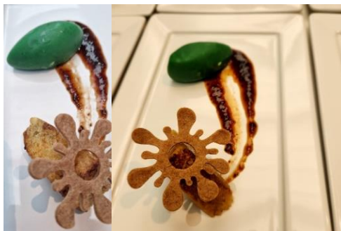
Figura 8 - Sobremesa de jiló