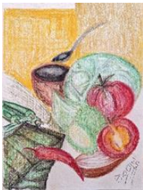
Figura 14 - Terceiro prato