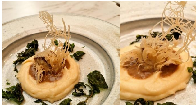
Figura 7 - Dim sum de rabada