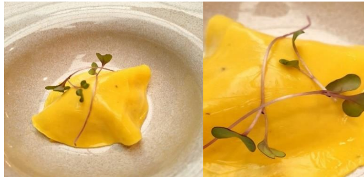
Figura 5 - Frango com arroz e pequi