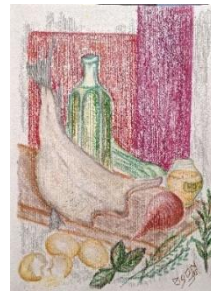
Figura 13 - Segundo prato