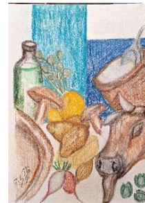
Figura 17 - Quinto prato