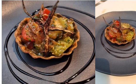
Figura 4 - Tartelete da horta exótica