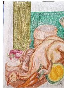
Figura 16 - Quarto prato