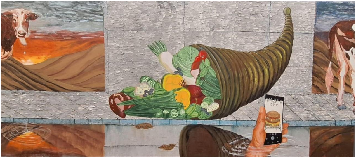
Figura 10 - Décadence avec Élégance