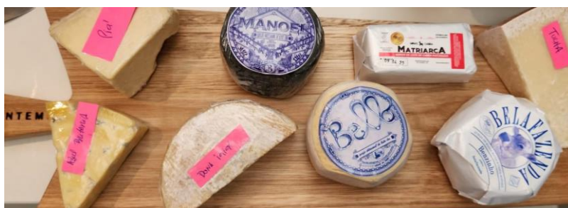
Figura 9 - Seleção de queijos nacionais

Diante de um público habituado à suavidade, servir queijos de caráter intenso é um gesto de confiança no experienciável.