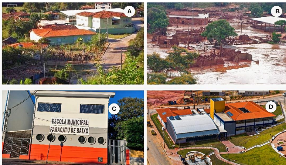
Figura 2- EMPB antes e depois do RBF

Fonte: Foto A: Furlani (2016). Foto B: Freitas (2015). Foto C: dados da pesquisa (2020). Foto D: Fundação Renova (2023).